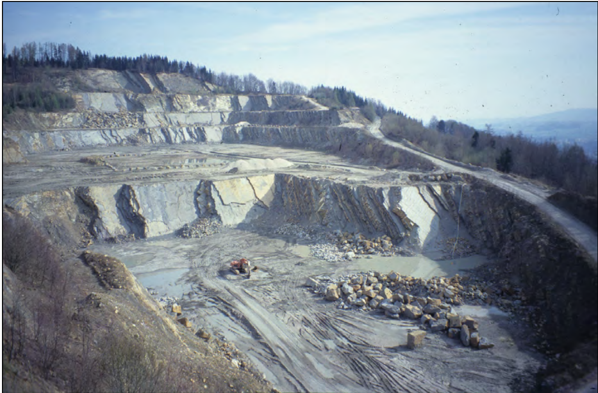
Abb. I: Steinbruch am Pinsdorfberg.

Thema: Altenglach-Formation (Ahornleiten-Subformation)