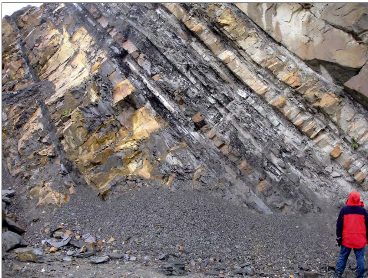
Abb. 2: Lithologie der Ahornleiten-Subformation im Steinbruch am Pinsdorfberg.

Die Abgrenzung der Ahornleiten-Subformation zur liegenden Roßgraben-Subformation ist durch das Auftreten von harten, hellen, scherbilig brechenden Kalkmergeln definiert, welche das Leitgestein der Formation bilden (s. Abb. 2). Die einzelnen Kalkmergellagen können eine Mächtigkeit von bis 8 m erreichen. Sie entwickeln sich jeweils aus turbiditischen, karbonatreichen Hartbänken und bilden den Abschnitt Td des BOUMA-Zyklus. Demgemäß lassen sie in ihren tieferen Anteilen häufig noch einen Gehalt an Siltfraktion erkennen, der gegen das Hangende aufgrund der Gradierung allmählich abnimmt. Einzelne Turbiditlagen (karbonatreiche Wacken und Siltkalke als Hartbänke und die dazugehörigen turbiditischen Kalkmergel) können Mächtigkeiten von bis zu 10m erreichen und sind damit die mächtigsten Turbidite des Rhenodanubischen Flysches überhaupt. Diese „Megabeds“ kommen vor allem im hangenden Teil der Subformation vor, weiter im Liegenden schwanken die Mächtigkeiten der einzelnen Lagen meist zwischen 1 m und 3 m. Die BOUMA-Abfolgen sind in der Ahornleiten-Subformation entweder vollständig oder aber mit fehlenden Basalabschnitten entwickelt. Weiche Tonmergel kommen in der Ahornleiten-Subformation üblicherweise nur selten vor, lokal – z.B. im Steinbruch der Gmunden-Zement am Pinsdorfberg – können sie aber auch verstärkt auftreten.