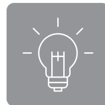
Didaktische Ansätze Kompetenzentwicklung