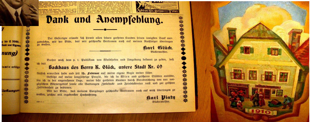
Einschaltung Bote v.d. Ybbs, Februar 1910