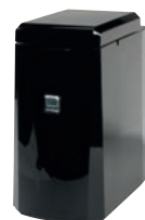
TM 1 L Milch - Peltierkühler; schwarz Art. Nr. 70000400