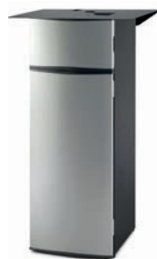
Unterschrank Art.-Nr. 1000 5004