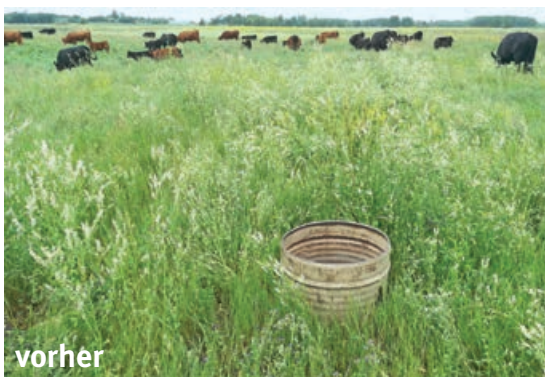
Die Besatzdichte als „Werkzeug“: Schon nach 27 Stunden sind bei hohem Weidedruck auch unerwünschte Pflanzen verbissen, wie der Vorher-Nachher-Vergleich zeigt.

Manuel Winter besuchte mehrere kanadische Mob Grazing Betriebe und schrieb die Bachelorarbeit „Konzepterstellung für die Weidestrategie Mob Grazing für einen Mutterkuhbetrieb in Niederösterreich“