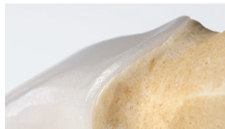
Sehr gute Passgenauigkeit