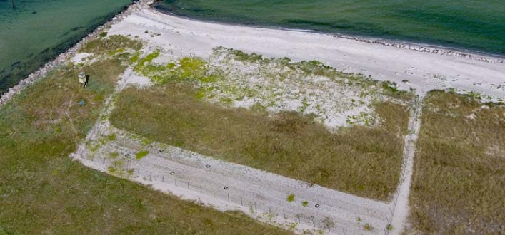
Das fuchssicher eingezäunte Brutfeld ist ca. 4500 m 2 groß