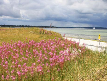
Weidenröschen auf der Düne