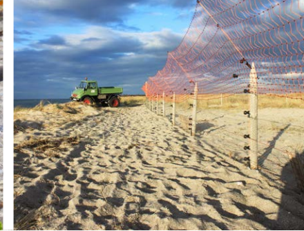
Elektrozaun gegen Beutegreifer