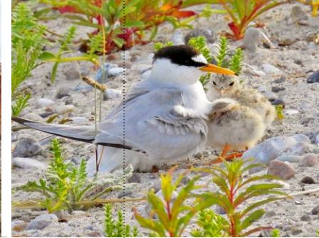
Zwergseeschwalben im Brutfeld