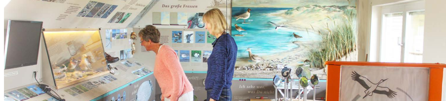
Willkommen in der NABU-Naturstation

Die Brutfelder dieser beiden letzten größeren Kolonien werden alljährlich von der aufkommenden Vegetation befreit und anschließend von ehrenamtlichen Mitarbeitern des NABU weitgehend fuchs- und mardersicher eingezäunt. Auf dem Bottsand wird eine etwa 4500 m 2 große Fläche mit einem 180 cm hohen Maschendraht abgezäunt und mit Elektrodrähten gegen ein Überklettern geschützt. Neben Zwerg- und Küstenseeschwalben, sowie einigen Sandregenpfeifern brüten auch Rot-schenkel, Graugänse, Mittelsäger und Schnatterenten in einer Vegetationsinsel innerhalb der eingezäunten