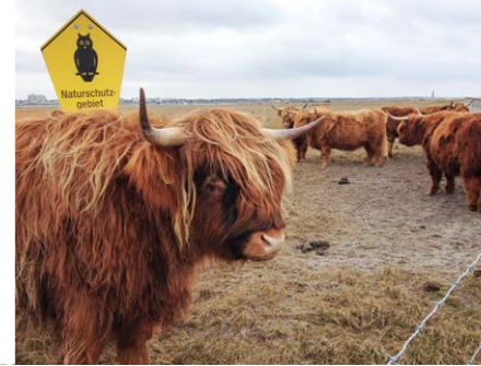
Winterbeweidung durch Hochlandrinder