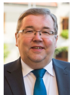
Josef Reindl Bürgermeister

Mögen durch dieses integrierte Stadtentwicklungskonzept entscheidende Impulse für die Zukunft unserer Stadt angestoßen werden. Sowohl mit den neuen Planungsvorschlägen als auch mit den als Fortschreibung aktualisierten Zielen im bereits vorhandenen Sanierungsgebiet können wir die 2004 begonnene und mit mehreren Projekten erfolgreich durchgeführte Altstadtsanierung fortsetzen und so die neuen Aufgaben der Zukunft meistern.