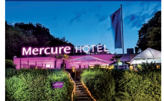
Mercure Hotel in Bielefeld Johannisberg

Auf der Spitze des Johannisbergs inmitten eines kleinen Parks befindet sich das Mercure Hotel Bielefeld Johannisberg. Die Kombination aus absoluter Ruhe, grüner Umgebung und die Nähe zum Stadtzentrum Bielefeld machen das Hotel zu etwas ganz Besonderem. Nur 10 Gehminuten trennen Hotelgäste von der Altstadt und dem Bahnhof.