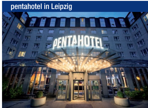
pentahotel in Leipzig