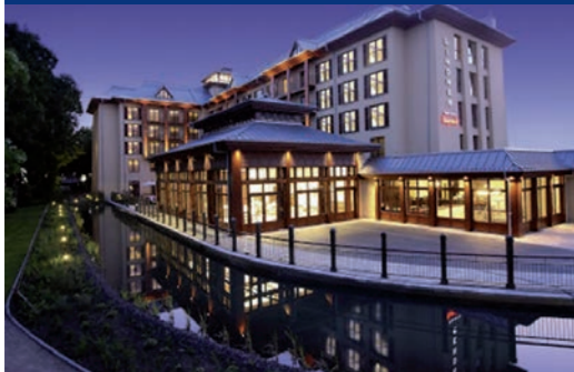
Lindner Park-Hotel Hagenbeck in Hamburg

Ein Haus von unverwechselbarer Gastlichkeit auf gehobenem 4-Sterne-Niveau mit herausragenden kulinarischen Genüssen und wunderschönen Designerzimmern. Das „Mintrops Land Hotel Burgaltendorf“ liegt auf der Ruhrhalbinsel und ist eine idyllische Oase zwischen den Ballungszentren.