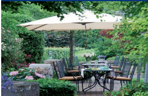
Mintrops Land Hotel Burgaltendorf in Essen

Zentral in Deutschland, eingebettet ins hessische Mittelgebirge, liegt in einem herrlichen Naturschutzgebiet das 4-Sterne-Hotel „Hessen Hotelpark Hohenroda“ mit Seeblick. Dieses Seminarhotel bietet auf 2.500 qm eine Menge Platz für Körper und Geist, denn hier kann man sich vom Komfort und der entspannten Atmosphäre verwöhnen lassen.