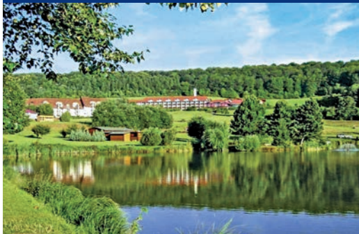
Hessen Hotelpark Hohenroda