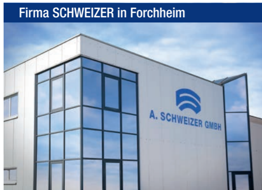
Firma SCHWEIZER in Forchheim

Sie wohnen nur wenige Gehminuten vom bekannten Leipziger Hauptbahnhof und der historischen Altstadt entfernt in der Nähe des Grassimuseums. Das moderne 4-Sterne Penta Hotel sorgt mit seinem 24-Stunden-Innenpool kombiniert mit zeitgemäßem Komfort und zuvor-kommendem Service für eine tolle Wohlfühlatmosphäre.