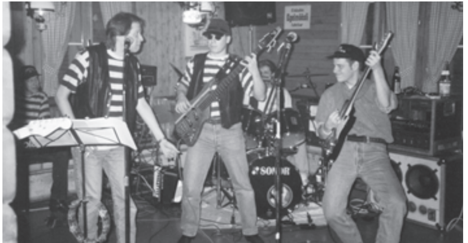
Nicht grosse Bands sind am Egelsee entscheidend, es muss der Funke zum Publikum überspringen.

Kurz darauf kommt Mäthu, welcher als Teamchef amtiert und bis zum bitteren Ende bleiben muss – ein hartes Los. Die Band macht einen Soundcheck, etwas laut für meinen Geschmack. Beim anschliessenden gemeinsamen Spaghettessen weist der «Chef» auch