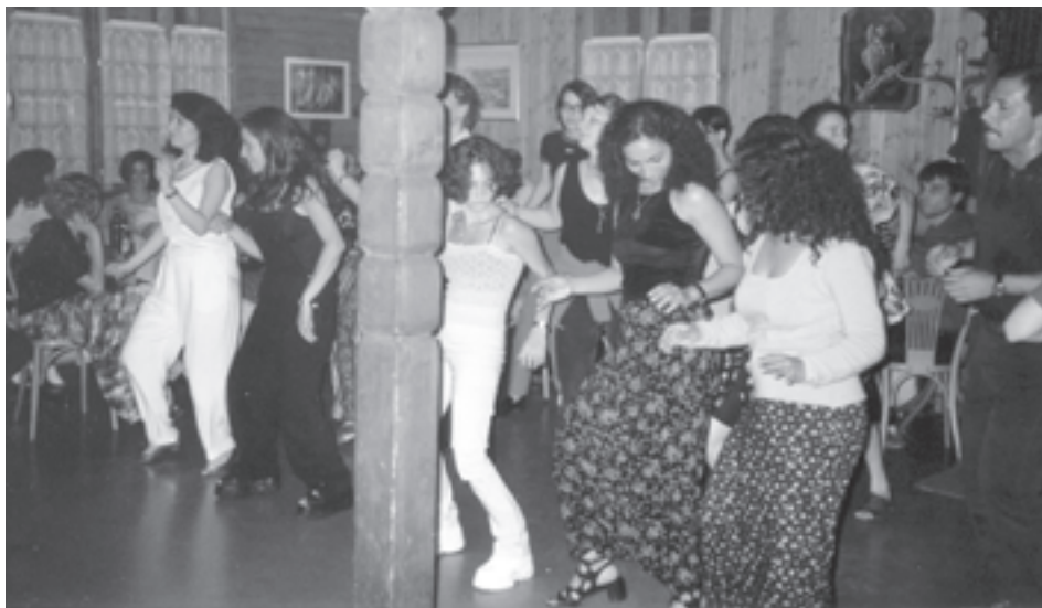
Schöner kann es nicht sein: Jugendliche tanzend im Hüttli – das wünschen wir uns alle.