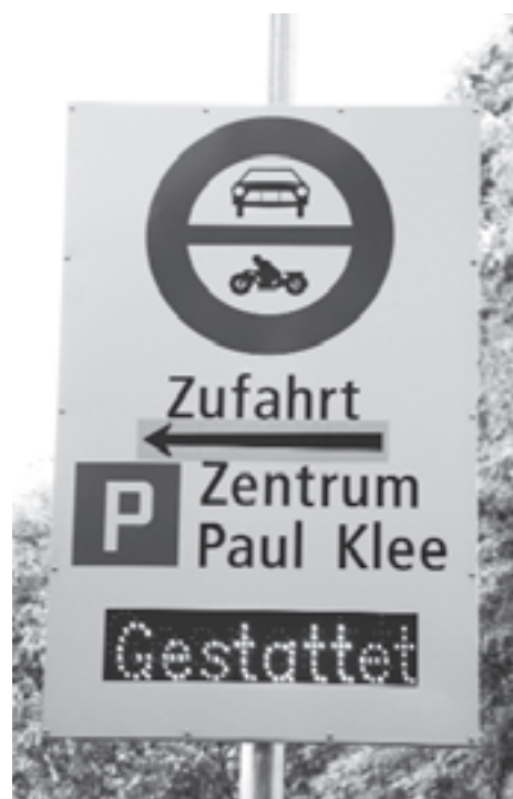
...und einmal, trotz Fahrverbot, gestattet.

Dem geeigneten Leser sei empfohlen, quasi als zweiten Satz, sich die Signalisation bei der gleich daneben befindenden Barriere anzusehen. Mit etwas Glück können dort auch Auswärtige beobachtet werden, die mit dem Mute der Verzweigung Autos rückwärts ins Strassengrün oder besser noch in den fließenden Verkehr zu wenden versuchen – und damit weitere Phantasien kreieren.