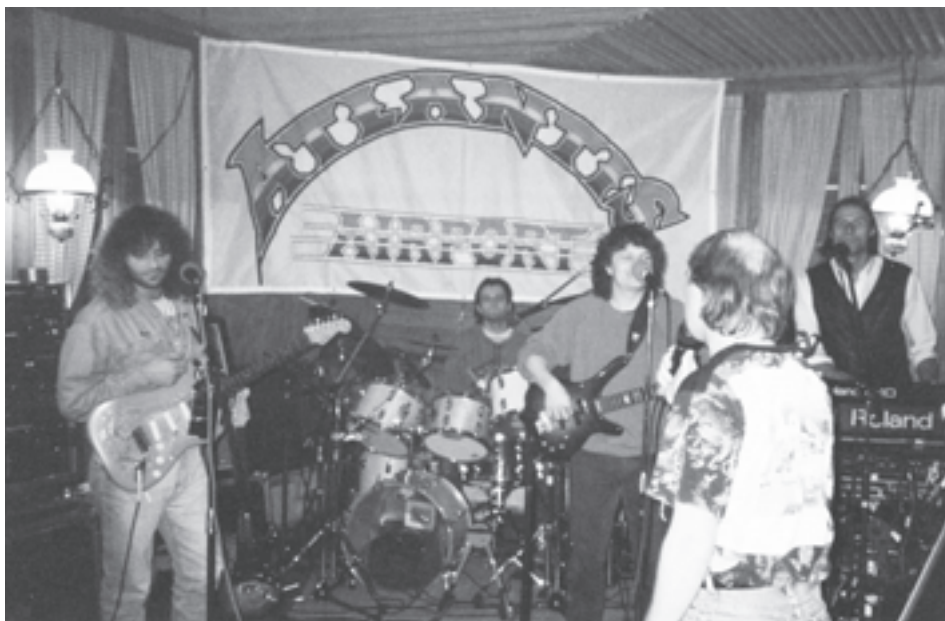
Atlantis Airport 17. April 1993.

Wie doch die Zeit im Fluge vergeht! Wer hätte gedacht, dass wir noch weitere 15 Jahre beinahe jeden Monat einen Konzertanlass auf die Beine stellen würden. Unser damaliges Motto lautete: «Bi üs isch jede willkomme, ob