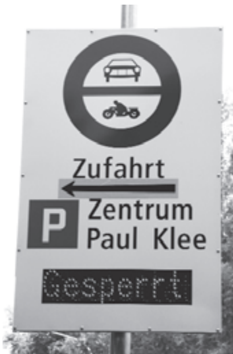
Verwirrung komplett: einmal gesperrt...

Leider gaben die Verantwortlichen schon nach kurzer Zeit dem Druck der Strasse nach und deuteten unglücklicherweise mit einem banalen Pfeil an,