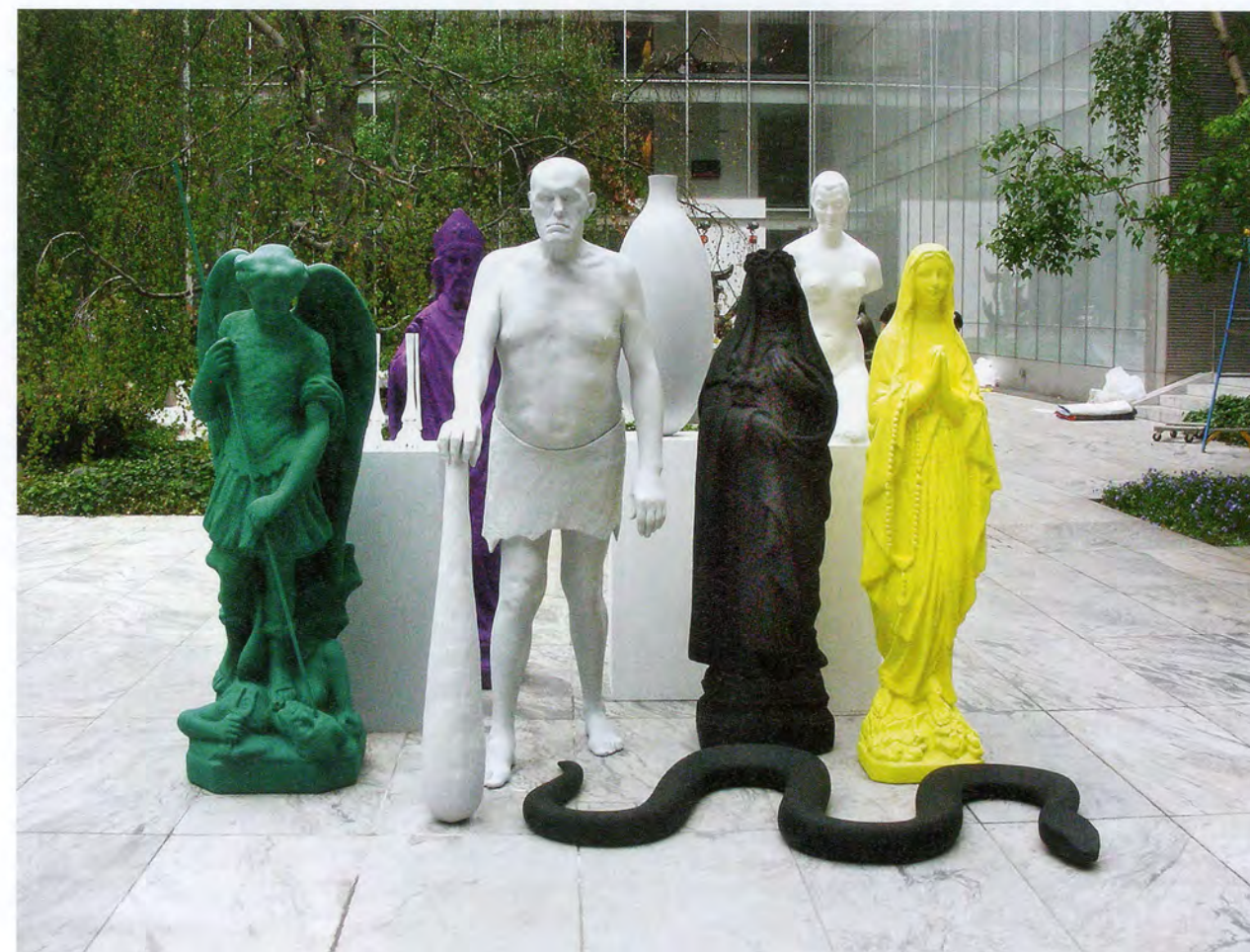
KATHARINA FRITSCH, GROUP OF FIGURES, 2006–08 (fabricated 2010–11), bronze, copper, stainless steel, lacquer, dimensions variable exhibition view, Sculpture Garden, MoMA, New York / FIGURENGRUPPE, Bronze, Kupfer, Stahl, Lack, Ausstellungsansicht. (PHOTO: KATHARINA FRITSCH)

It was the first time that I presented them as a group.