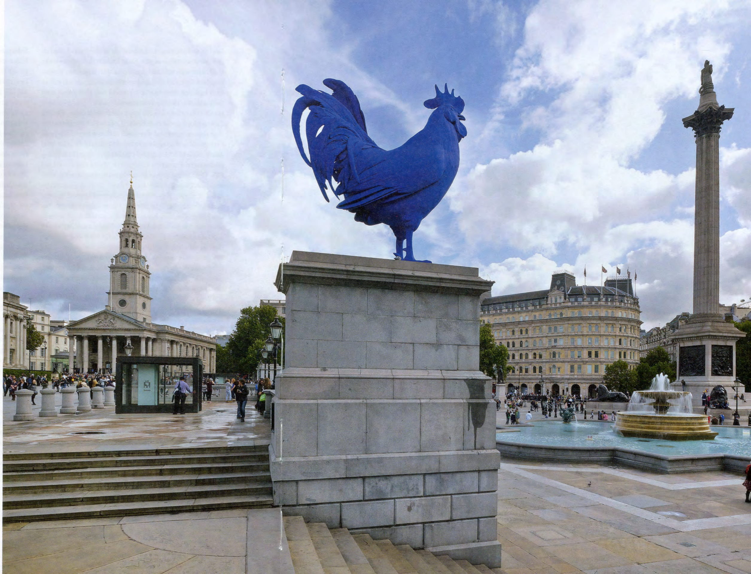
KATHARINA FRITSCH, COCK, 2010, glass fiber, reinforced polyester resin, stainless steel structure, Fourth Plinth, Trafalgar Square, London, hight 185 3/4" / HAHN, Fiberglas, verstärktes Polyesterkunstharz, Stahlstruktur, Höhe 472 cm.