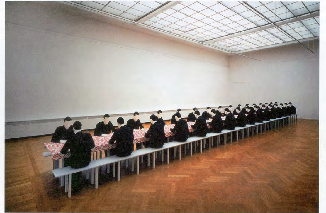
KATHARINA FRITSCH, COMPANY AT TABLE , 1988, polyester, wood, cotton, paint, 629 15 / 16 x 68 7 / 8 x 59" / TISCHGESELLSCHAFT , Polyester, Holz, Baumwolle, Farbe, 1600 x 175 x 150 cm.

JB: MUSEUM, MODELL 1:10 (Museum, 1:10 Model, 1995), which you designed for the German Pavilion at the 1995 Venice Biennale, is also octagonal, like ACHT TISCHE MIT ACHT GEGENSTÄNDEN . This ideal building for art recalls the medieval architecture of octagonal baptisteries or the Citadel built by Emperor Frederick the Second. You have centered it on a plinth, also octagonal, where it is surrounded by a strictly geometrical park of 200 trees cut out in the middle to form an eight-point star. Artforum pictured the work on the cover of their September issue that year, and Jean-Pierre Criqui wrote a glowing review, "Best of Show."