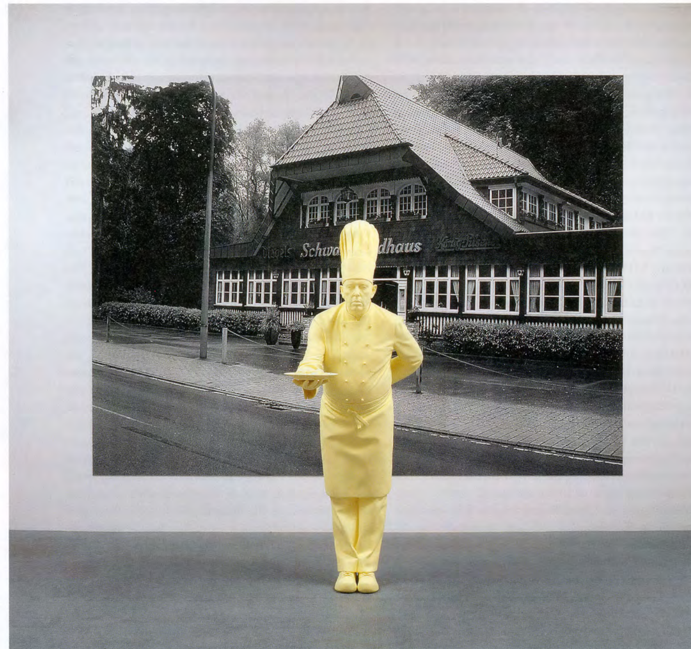
KATHARINA FRITSCH, COOK, 2008, polyester, color, 79 1/2 x 30 x 40 1/8"; PHOTOGRAPH 6 (BLACK FOREST HOUSE), 2006/2008, silkscreen, plastic, paint, 110 1/4 x 147 3/4" / KOCH, Polyester, Farbe, 202 x 76 x 102 cm; 6. FOTO (SCHWARZWALDHAUS), Siebdruck, Kunststoff, Farbe, 280 x 375 cm.