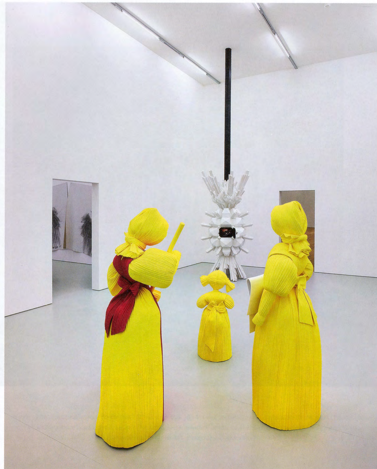
KATHARINA FRITSCH, DOLLS, 2016, epoxy resin, polyurethane, acrylic / PUPPEN, Epoxidharz, Polyurethan, Acryl, installation view, Schaulager Basel / ALEXEJ KOSCHKAROW, COLD OVEN, 2016, ceramics, metal, electric light, motor / KALTER OFEN, Keramik, Metall, elektrisches Licht, Motor.

KF: Wochenlang hatte ich mit Restauratoren in einem Raum in diesem Bau die Wände geschliffen und sie dann mit purpurroter Farbe gespritzt, bis wir diese samtene Oberfläche hinkriegten, die ich gesucht hatte. Der Raum blieb sonst leer. Ich wollte ihn mit minimalen Eingriffen belassen, weil der Blick aus dem Fenster von Geschichte nur so geschwängert ist. Zur Linken Hermann Görings Reichsluftfahrt-Ministerium, unten das Dokumentationszentrum Topo-