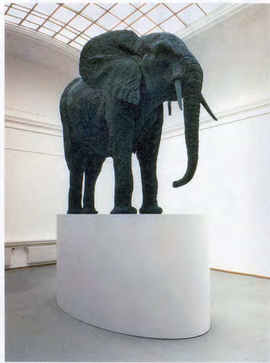
KATHARINA FRITSCH, ELEPHANT , 1987, polyester, wood, paint, 63 x 165 3 / 8 x 149 1 / 2 / ELEFANT , Polyester, Holz, Farbe, 160 x 420 x 380 cm.

KF: In contrast to Germany, where the reviews were devastating. They accused me of having a Nazi mentality and touting totalitarian aesthetics.