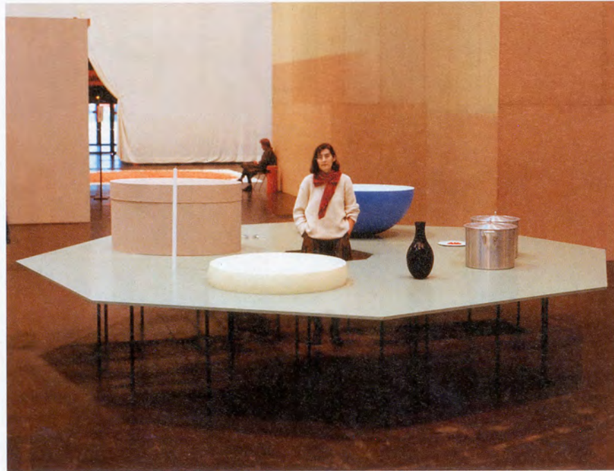
KATHARINA FRITSCH, EIGHT TABLES WITH EIGHT OBJECTS, 1984 (detail), MDF board, steel, objects dating from 1981–4, 8 assembled tables, diameter 189", height 61" / ACHT TISCHE MIT ACHT GEGENSTÄNDEN, Detail, MDP-Platte, Stahl, Objekte von 1981–4, arrangierte Tische, Durchmesser 480 cm, Höhe 155 cm.

monochrome energiegeladene Farbigkeit. Zwei Elemente, die ihnen betörende Klarheit verleihen, sie im Nu erfassbar machen, aber auf eine irritierende Weise sowohl physisch wie immateriell, vertraut wie unwirklich erscheinen lassen. Wir beauftragten sofort in Parkett 13 die Künstlerin Jutta Koether, einen kurzen Text über den Elefanten zu schreiben.