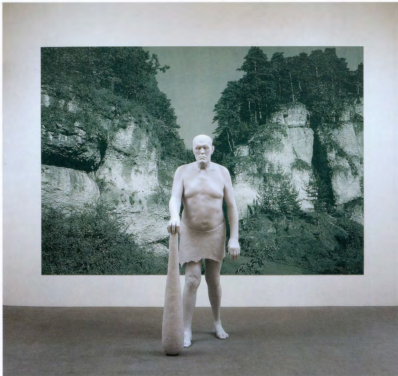
KATHARINA FRITSCH, GIANT, 2008, polyester, paint, 76 3/4 x 37 1/8 x 27 1/2"; POSTCARD 4 (FRANCONIA), 2008, silkscreen, plastic, paint, 110 1/4 x 159 1/2" / RIESE, Polyester, Farbe, 195 x 95 x 70 cm; 4. POSTKARTE (FRANKEN), Siebdruck, Kunststoff, Farbe, 280 x 405 cm.