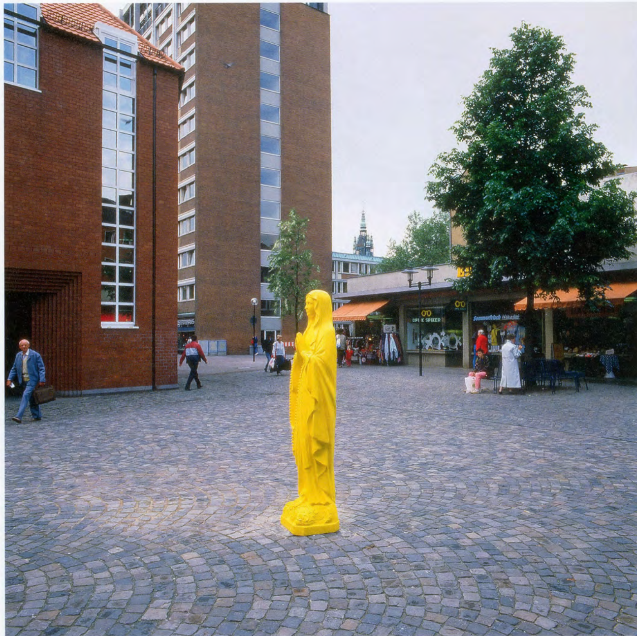
KATHARINA FRITSCH, MADONNA FIGURE, 1987, epoxy resin, paint, 13\frac{3}{8} \times 15\frac{3}{4} \times 66\frac{13}{16} " / MADONNENFIGUR, Epoxidharz, Farbe, 40 x 34 x 170 cm.