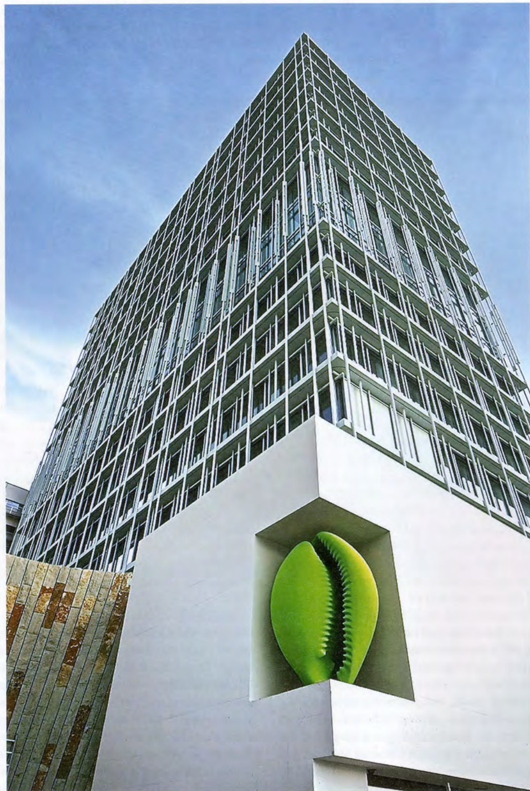
KATHARINA FRITTSCH, CONCH (LIGHT GREEN), lacquered bronze casting, 111 1/2 x 68 7/8 x 70", building: Asklepios by Herzog & de Meuron / MUSCHEL (HELLGRÜN), 2015, lackierter Bronzeguss, 283 x 175 x 178 cm.

KF: I put him in front of a Neandertal landscape and wanted to create a whole scenario that way. With silk screens, I can generate special lighting in the space, and make the atmosphere a little shady. In the case of KOCH (Cook, 2008), I was interested in the combination of the light-yellow figure against the black-and-white picture of the Schwarzwaldhaus (Black Forest House), which had been taken on a rainy day. He is supposed to look inviting, but usually you see figures like that in front of bad restaurants that are trying to lure you in. Incidentally, you would never see a real Black Forest house in Neandertal anyway. The whole thing is based on impressions from certain films of the '50s and '60s that interest me.