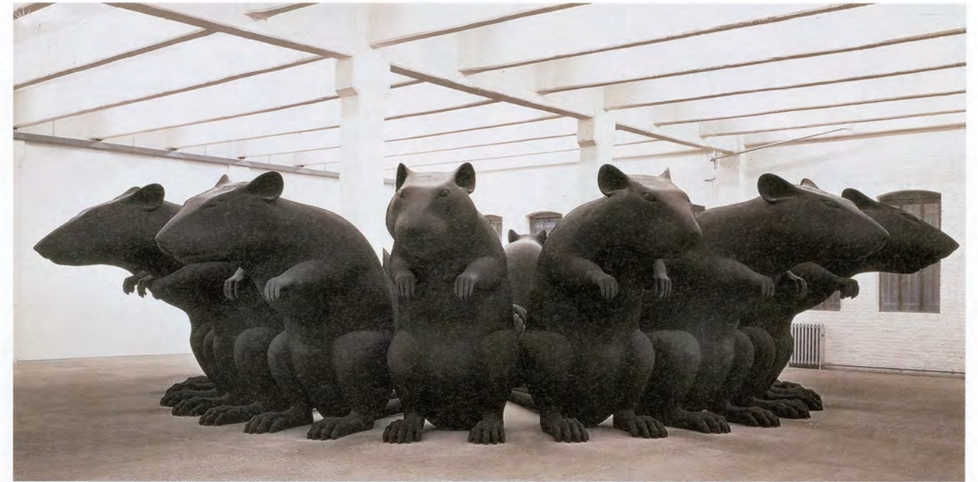
KATHARINA FRITSCH, RAT-KING, 1991–3, polyester, paint, diameter 511 12/16", height 110 1/2" / RATTENKÖNIG, Polyester, Farbe, Durchmesser 1300 cm, Höhe 280 cm.

Offensichtlich magst du die Zahl Acht. Sie taucht auch in deinem alpträumhaften RATTENKÖNIG (1991–93) mit den sechzehn identischen, am Schwanz verknoteten Ratten auf oder in der TISCHGESELLSCHAFT (1988), wo zweiunddreissig Mal die-