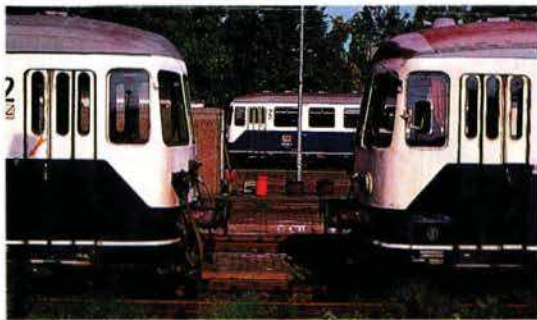
Abgestellte 515 in Wanne-Eickel.