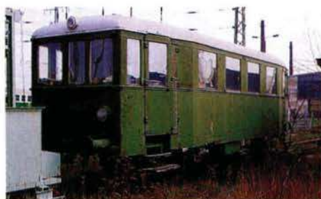
VB 140 263 in Cottbus.

Die neu gegründete Westfälische Tourismus Bahn GmbH mit Sitz in Ahlen will versuchen, die Schnelltriebzüge der Baureihe 403 und zwei Garnituren des Akku-Triebwagens 515 für Sonderfahrten zu erhalten. Vorstellbar ist auch eine Zusammenarbeit mit der Internationalen Bau-Ausstellung Emscher Park GmbH (IBA). Ab 1996 und insbesondere während der Bundesgartenschau 1997 will die IBA Zechenbahnfahrten durchführen.