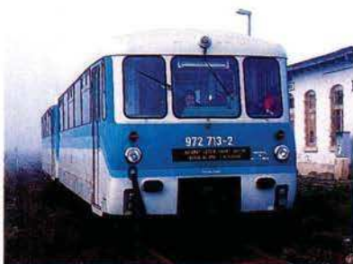
972 713 und 772 113 am letzten Betriebstag im Haltepunkt Ufrungen.