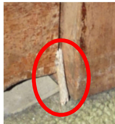
KLEINE HOLZSTIFTE Lehnen an der Tür