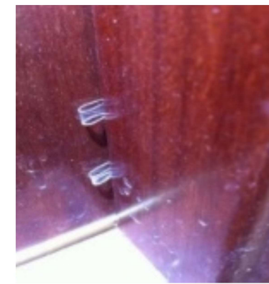
KLEINE PLASTIKTEILE Eingeklemmt zwischen Tür und Rahmen

DIES BESTÄTIGT DEM TÄTER, DASS DIE WOHNUNG LEER STEHT.