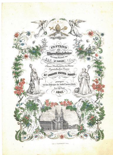
Objekt 21: StadtASC, NA, Bd. 1206.