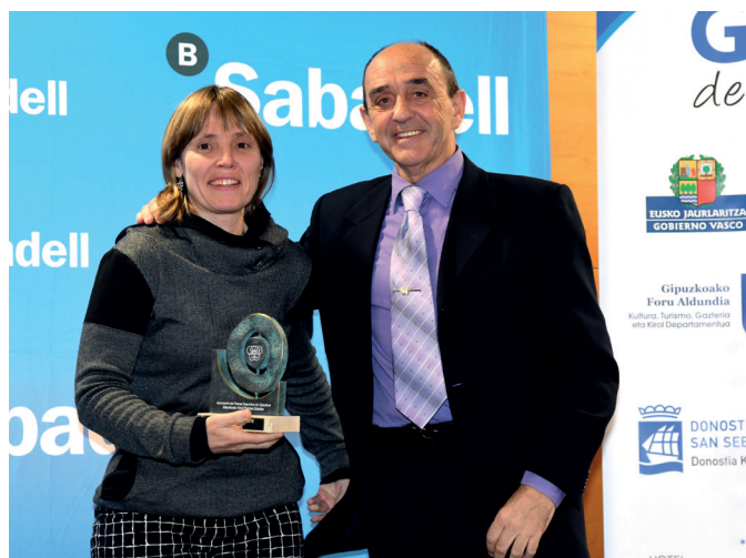
Homenaje a Urdaburu en la Gala de la Asociación de la Prensa Deportiva Gipuzkoana (27-12-2017)