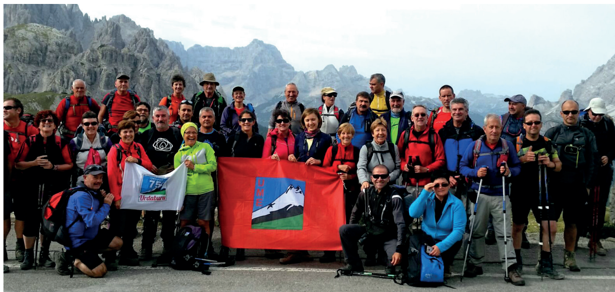
Viaje a Alpes. Dolomitas, cimas de Lavaredo.