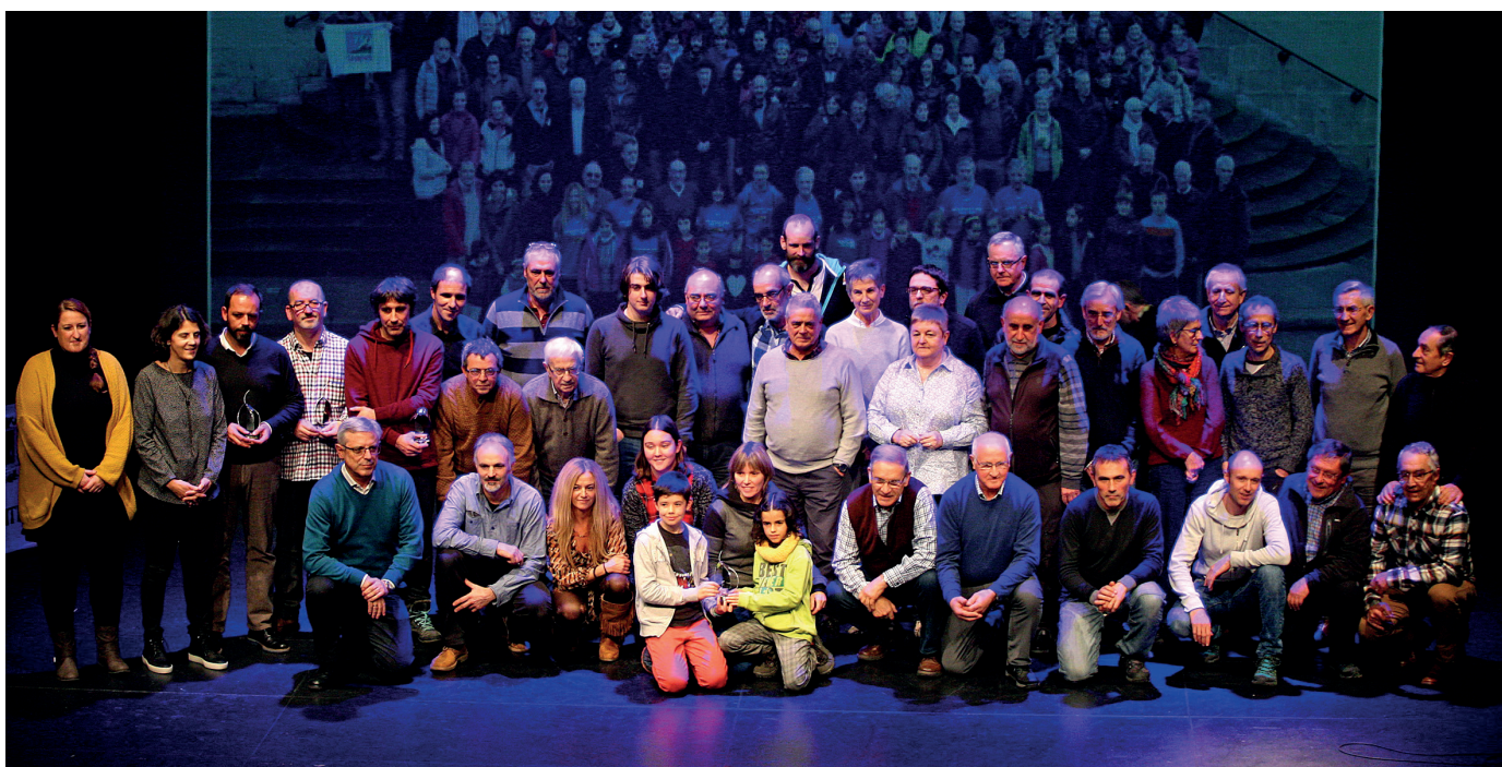
Homenajeados en la Gala del Deporte de Erretereria (13-12-2017)