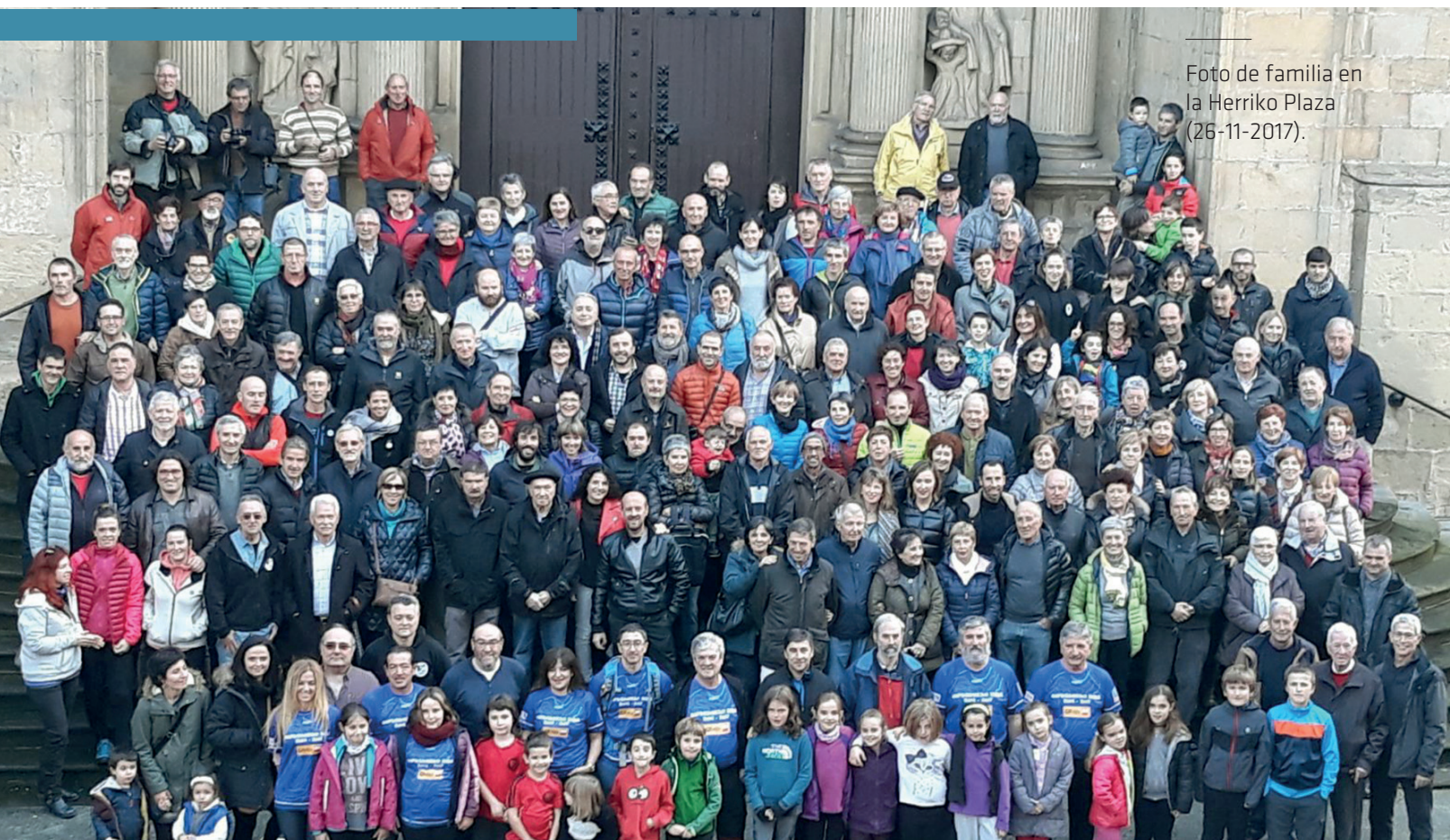
Foto de familia en la Herriko Plaza (26-11-2017).