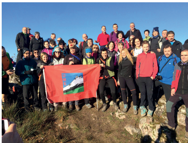
En la cima del Urdaburu el día 1 de enero de 2017.

Asimismo, hacía referencia a los actos y actividades realizados hasta aquellas fechas, mediados de año, y que habían sido programadas para tal evento. Ha transcurrido un año y en esta ocasión nos toca decir que el Grupo de Montaña Urdaburu cumplió, y creemos que por todo lo alto, 75 años. El pasado año fue un año muy intenso, plagado de actos y actividades que se desarrollaron para celebrar tan importante efeméride.