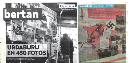
Urdaburu en 450 fotos. Exposición sobre la red comete.