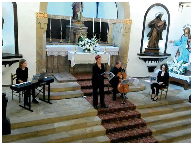
Concierto en la Basílica (26 11-2017).