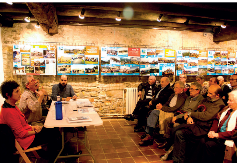
Presentación del libro en la sala Xenpelar (13-02-2017).