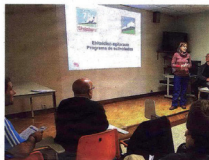
Urdaburu. Los actos del 75 aniversario se presentarán varias semanas en su sede. A. Arrenzana

El grupo de montaña Urdaburu celebra su 75 aniversario este año, ha organizado una exposición de fotografías para celebrar este aniversario. La ciudad muestra un programa de actividades que durará cada año de estos 75 años y se agrupan fundamentalmente en dos bloques. Recorren las diferentes actividades y modalidades desarrolladas en el seno de Urdaburu: espeleología, escalada, alpinismo, espeleología, senderismo, etc. Como la salida recreativa de todo tipo (senderos y rutas sencillas, excursiones familiares, senderos de interés, grupo de senderismo y grupo de alpinismo, etc.) y por último, el programa de actividades que se realiza en el interior de la casa de Txema Arrenzana.