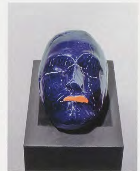
ANDRO WEKUA, HEAD I, 2006, ceramic mask, 8 x 6 1/4 x 9"; wooden pedestal, 45 1/4 x 8 1/4 x 3 1/2" / KOPF I, Keramikmaske, 20,5 x 16 x 22,5 cm; Holzsockel, 115 x 21 x 27 cm.