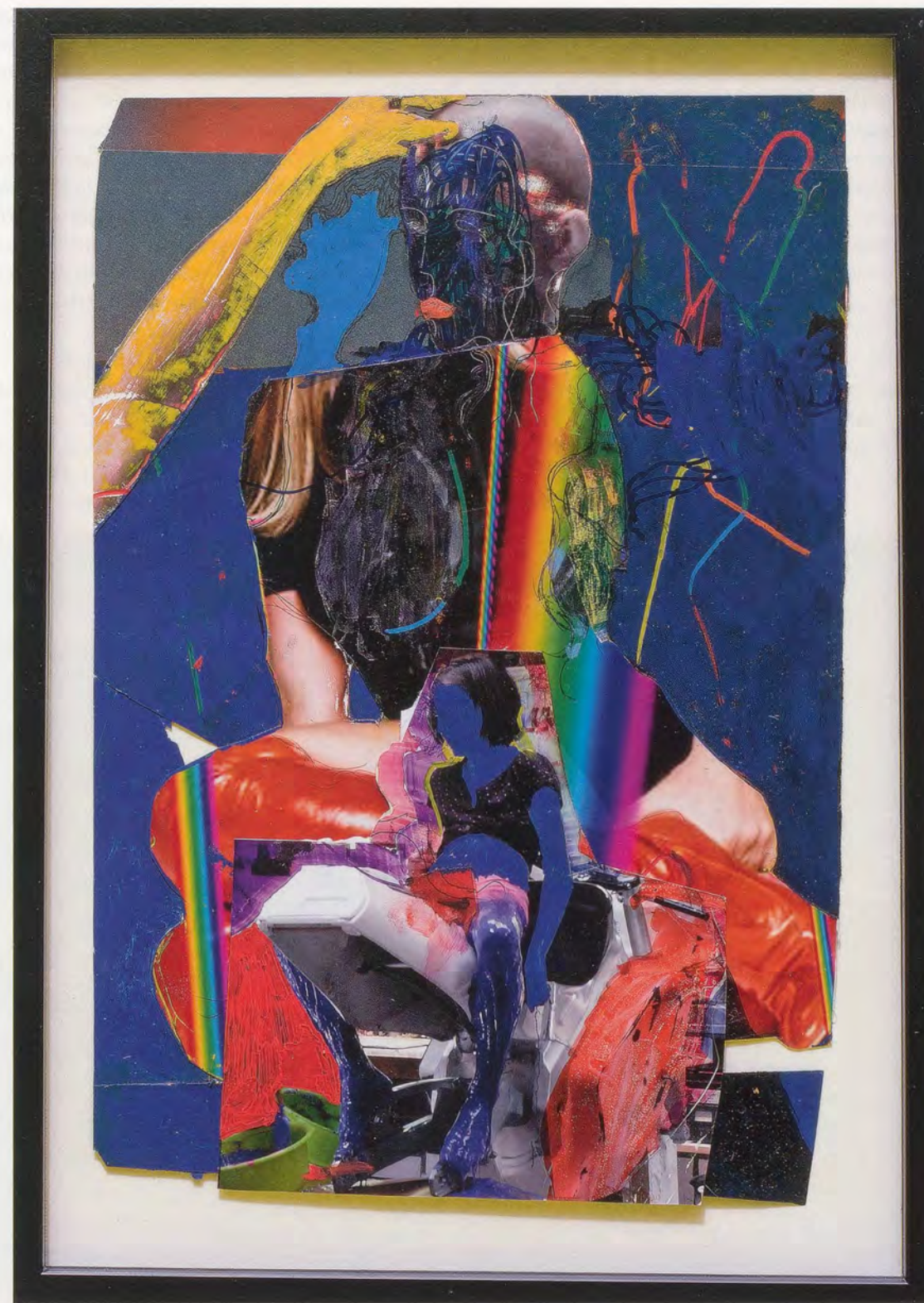
ANDRO WEKUA, MY BIKE AND YOUR SWAMP (YESTERDAY) 2 , 2008, felt pen, paint marker, colored pencil, ball pen on photo, 12 x 11 3/8" / MEIN FAHRRAD UND DEIN SUMPF (GESTERN) 2, Filzstift, Marker, Farbstift, Kugelschreiber auf Photographie, 30,5 x 20,3 cm.