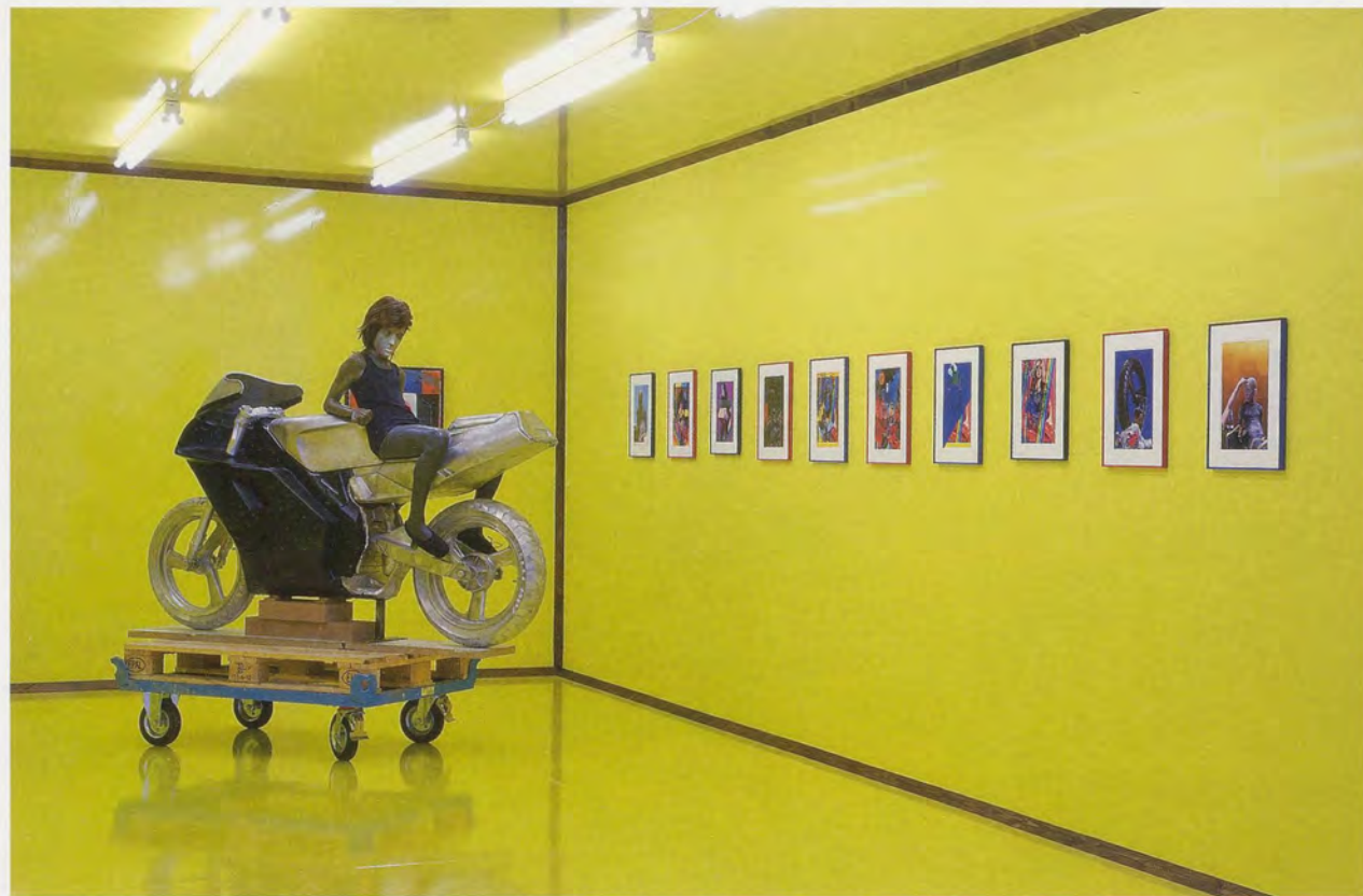
ANDRO WEKUA, MY BIKE AND YOUR SWAMP (6 PM), 2008, black polyurethane rubber, wax, aluminum, wood, cloth, artificial hair, 73 1/4 x 33 7/8 x 79 1/2", exhibition view Camden Art Centre, London / MEIN FAHRRAD UND DEIN SUMPF (18 UHR), schwarzer Polyurethan-Gummi, Wachs, Aluminium, Holz, Gewebe, künstliches Haar, 186 x 86 x 202 cm, Ausstellungsansicht.

beliebige Identität verleihen. Die augenlose Puppe wird unpersönlich, anonym. Durch ihre Blendung verschiebt sich die ursprünglich symmetrische Beziehung zwischen Betrachter und Objekt. Nur der Erstere genießt das Privileg des Sehens. Er kann auf die kleine weibliche oder männliche Figur projizieren, was er will, ohne dass diese in der Lage wäre, den Blick zu erwidern.