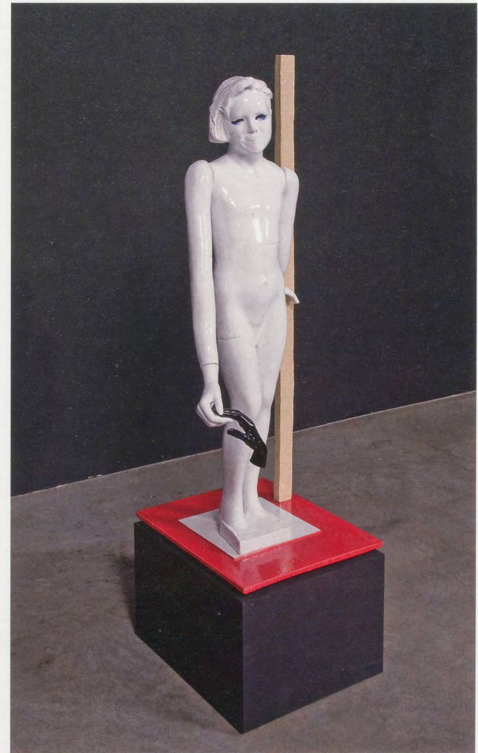
ANDRO WEKUA, HOLDING , 2007, ceramic, 22 1/2 x 20 x 66 1/4" / HALTEN , Keramik, 57,2 x 50,8 x 168,3 cm.

Wekuas Gemälde, Collagen, Filme, Skulpturen, Texte und vergängliche Objekte verweben mannig-