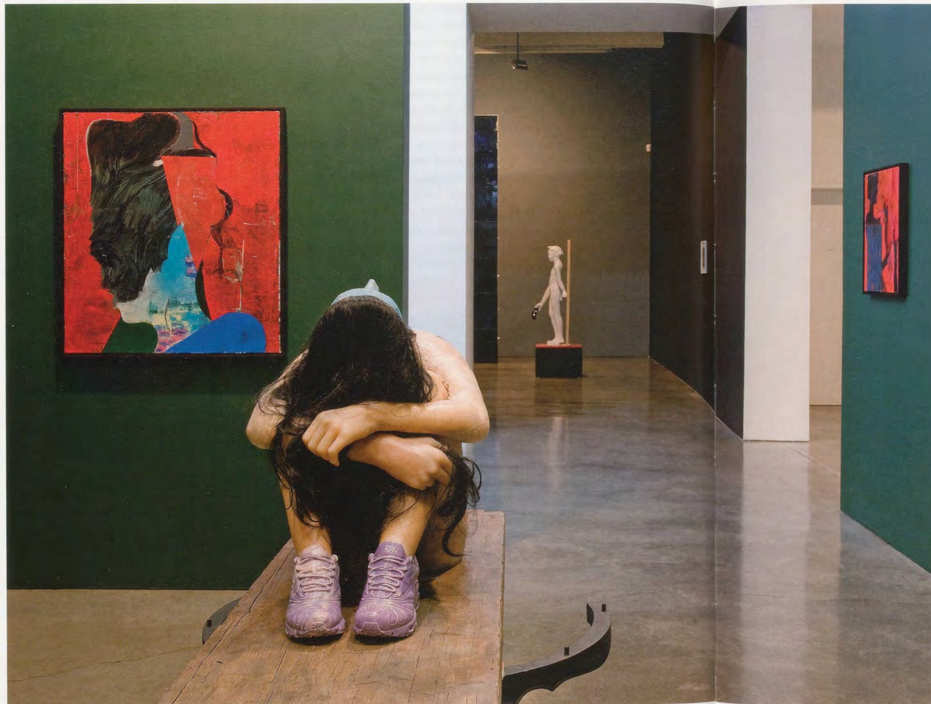
ANDRO WEKUA, SNEAKERS 1 (PURPLE SNEAKERS), 2008, wax figure, aluminum cast table, pallet, acrylic board, ceramic, shoes, 59 x 72 7 / 8 x 39 3 / 8 " exhibition view Gladstone Gallery, New York / TURNSCHUHE 1 (LILA TURNSCHUHE), Wachsfigur, Aluminiumgusstisch, Palette, Akrylharzbrett, Keramik, Schuhe, 150 x 185 x 100 cm, Ausstellungsansicht.

Wekua is presently working on the architectural history of the city in which he was raised, Sukhumi, a seaside resort town that was once part of the Republic of Georgia but is today occupied by Russia. In the 1990s, Sukhumi was at the heart of an ethnic cleansing campaign. Wekua's family, like many others, left—and he hasn't been back since. The city has been left mostly empty, like a ravaged carcass. It is a pale imitation of what it once was. Its glamorous buildings damaged by war are now mostly abandoned. Perhaps a bit like Beirut, Sukhumi exists as a memory of its former glory.