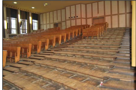
Abbildung 2: Foyer und Hörsaal POT 81 während der Modernisierungsmaßnahmen

Im Laufe des Jahres 2012 soll der POT 81 wieder dem universitären Lehrbetrieb zugeführt werden. Auch die studentische Cafeteria „U-Boot“ soll dann – mit besseren Zugangsmöglichkeiten – wieder ihren Betrieb aufnehmen.