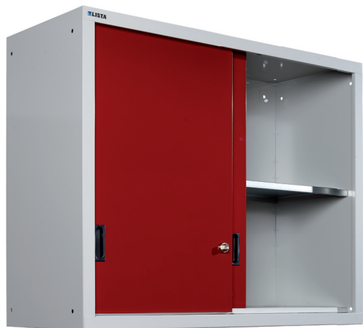
Art.-Nr. 57.089.070 Schiebetüren Rubinrot, RAL 3003