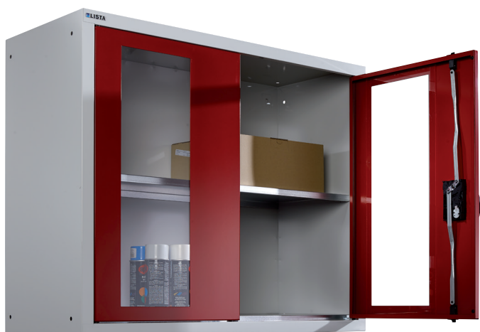
Art.-Nr. 57.056.070 Sichtfenster-Flügeltüren Rubinrot, RAL 3003