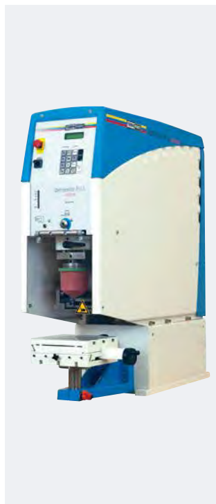
HERMETIC 9-12 universal