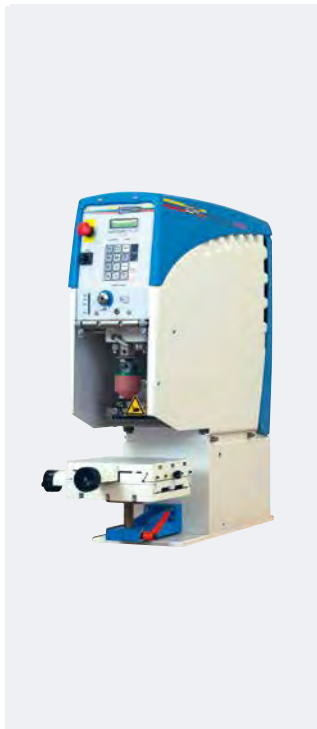
HERMETIC 6-12 universal

Die HERMETIC 150 erreicht neben den genannten Vorzügen eine max. Druckbildgröße von Ø 140 mm. Eine Restfarbenabholung (Option) kann wahlweise rechts oder links montiert werden.