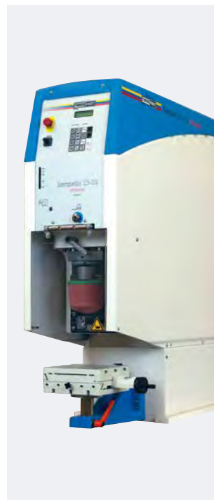
HERMETIC 13-12 universal