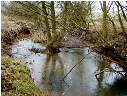
Renaturierte Asphe

Auen und ihre Fließgewässer sind die Lebensadern in unserer Landschaft. Ihre Ausprägung wird vom ständigen Wechsel und der Kraft des fließenden Wassers bestimmt. Abflussverhalten, Strömung, Schleppkraft, Wassertemperatur, Sauerstoffgehalt und nicht zuletzt Hochwasser und Überschwemmungen sind die Faktoren, die zusammen mit den geologischen Gegebenheiten des Einzugsgebietes ein differenziertes Standortmosaik in Bach und Aue bedingen. Je vielgestaltiger diese Standorte ausgeprägt sind, desto artenreicher sind die Lebensgemeinschaften.