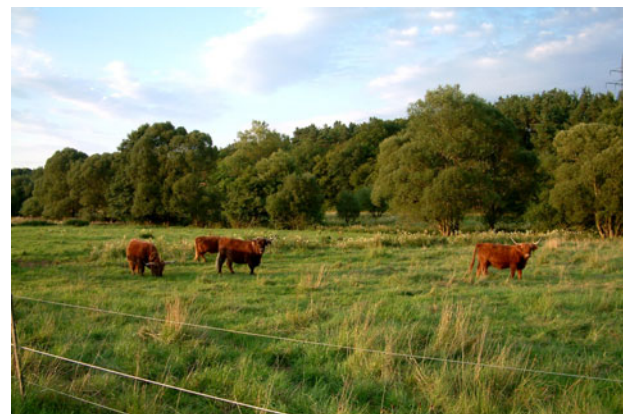
Großkoppel mit Hochlandrindern

Um die Asphe jedoch als halboffene Grünlandaue zu erhalten, initiierte die Ortsgruppe Münchhausen des Naturschutzbundes zusammen mit der unteren Naturschutzbehörde des Landkreises ein Naturschutzprojekt. Dessen Ziel ist es, der Asphe Möglichkeiten zu einer naturnahen Eigenentwicklung zu geben und die Aue als extensiv genutztes Grünland für autotypische Lebensgemeinschaften offen zu halten. Da moderne landwirtschaftliche Maschinen für die Bewirtschaftung nasser Flächen kaum geeignet sind, lässt sich eine hohe Strukturvielfalt und Biodiversität sowohl im als auch am Bach durch eine großflächige Beweidung sicherstellen. Die Art der Weidetiere, ob Rinder, Pferde, Schafe oder Ziegen, erzeugt dabei aufgrund unterschiedlichen Fressverhaltens und Besatzdichte verschiedene Vegetationsstrukturen. Dabei bestimmt nicht nur die Vorliebe der Tiere für bestimmte wohlschmeckende Pflanzen das Erscheinungsbild der Weide, sondern auch die Fressmethode oder der Tritt der Tiere. Neben sehr kurzgrasigen Flächen kommen Bereiche mit sogenannten ‚Weideunkräutern‘ vor, die aber äußerst anlockend für blütenbesuchende Insekten sind. In wenig befressenen Flächen siedeln sich Gehölze an. Mit der Zeit entsteht eine von Grünland und Einzelbäumen geprägte Landschaft. Solche Parklandschaften sind von besonderem Reiz für unsere Erholung, da sie sehr abwechslungs- und entdeckungsreich sind