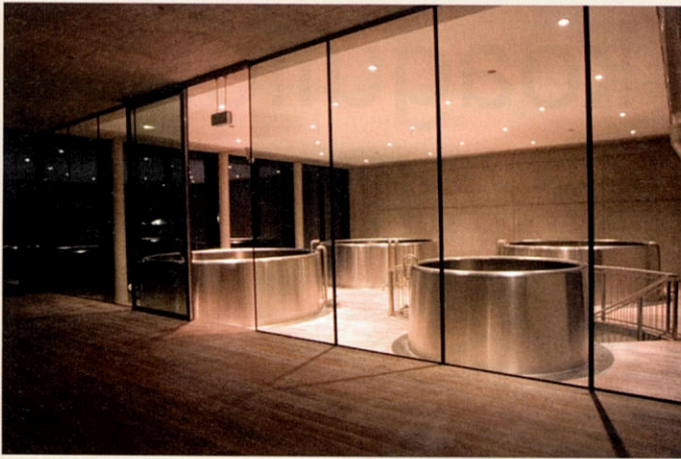
Die moderne Architektur ermöglicht vom Gastraum und von außen einen direkten Einblick in den Gärkeller