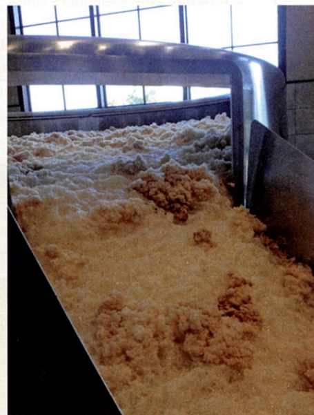
Ein spezieller Verschluss für die Öffnung des Überlaufschnebels garantiert eine optimale Reinigung

Steht nun die Reinigung des Bottichs an, werden über diesen mit Lochreihen perforierten Spritzring die entsprechenden Reinigungsflüssigkeiten aufgetragen, die dann über einen Ablauf im Boden des Gärbehälters abfließen können. Das funktio-