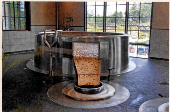
Sierra Nevada setzt ebenfalls auf die innovative Konstruktion aus Regensburg

nirt so gut, dass die Bottiche innerhalb von rund 90 min vollautomatisch gereinigt und desinfiziert werden. Der Reinigungsring hat darüber hinaus eine weitere Funktion: Während der Gärung dient er auch der Abführung der Gärungskohlensäure. Bislang hatten nur geschlossene Systeme den großen Vorteil, dass man sie erstens perfekt reinigen und zweitens das bei der Gärung entstehende Kohlendioxid kontrolliert abführen konnte. Dieses Manko der offenen Gärführung konnten die Regensburger lösen.