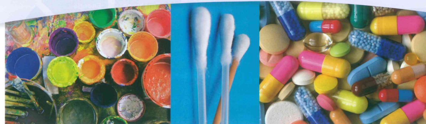
Essensreste, Hygieneartikel und erst recht Medizin gehören auf keinen Fall in die Toilette. Sie belasten nicht nur das Abwassersystem, sondern können im schlimmsten Fall die biologische Reinigung der Kläranlage aus dem Gleichgewicht bringen!

Saugstark und reißfest – Feuchttücher lassen sich heute in fast jeder Wohnung finden. Der Absatz steigt ständig, in Deutschland jährlich um acht Prozent (heißt Verdoppelung aller 10 Jahre). Die Kunden benutzen sie als Brillentücher, zum Abschminken, Wischen bzw. in der Säuglings- oder Alten-