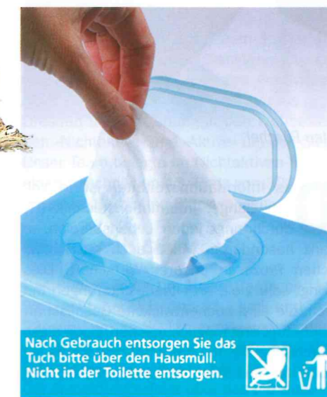
Nach Gebrauch entsorgen Sie das Tuch bitte über den Hausmüll. Nicht in der Toilette entsorgen.