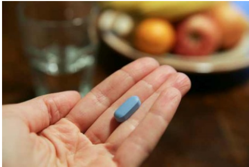
PrEP: Eine mögliche Safer Sex-Strategie

Wenn mir jemand sagt, er oder sie mache nur Safer Sex, denke ich als altes Aidshilfefossil, ehrlich gesagt, immer noch spontan ausschließlich an die Verwendung von Kondomen. Ich bin seit 25 Jahren in der Aids-hilfearbeit und bin in den 1990er-Jahren