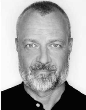
Foto: Christopher Knoll, psychologischer Berater bei der Münchner Aids-Hilfe

Die Münchner Aids-Hilfe hat angefangen, HIV-Test-Ergebnisse auch am Telefon mitzuteilen. Die Erfahrungen sind positiv, auch wenn das Vorgehen einen Paradigmenwechsel in der HIV-Prävention darstellt.