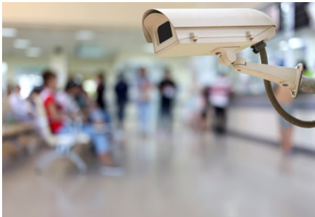
Kameras zur Sicherung von Urinkontrollen verletzen die Intimsphäre der Patient_innen und sind deshalb unzulässig.