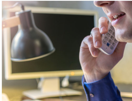
Telefonische Ergebnismitteilung: lange Zeit ein Tabu für Aidshilfe.

Es gab vier HIV-positive Ergebnisse, 13 positive Abstriche auf Chlamydien und Gonokokken sowie eine Hepatitis-B-Infektion. 72 Personen fragten das Ergebnis telefonisch ab, darunter auch drei mit einem HIV-positiven Ergebnis. Alle drei Männer kamen von