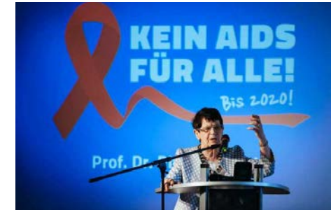
Prof. Dr. Rita Süßmuth, ehemalige Bundesgesundheitsministerin, bei der Auftaktveranstaltung im Spreespeicher. Sie begrüßt die Idee, auch Ärzt_innen und Beschäftigte im Gesundheitswesen mit der Kampagne anzusprechen. Niemand solle sein „Andersein“ dort verstecken müssen.