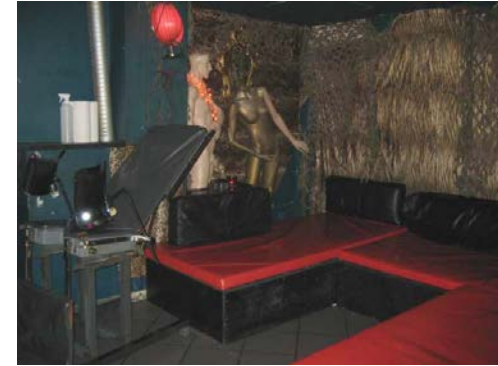
Im Sexklub Kondom weggelassen: durchaus ein Risiko für eine HIV-Übertragung. Doch welcher Test ist dann der richtige?.