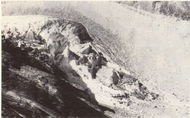
Zungenende des Sulzenaufenerners.

Die Vorstoßtendenz an den Gletschern im Pitz- und Kaunertal hat sich verstärkt. Mit +7,56 m ist der Gebietsmittelwert der 7 vermessenen Zungen größer als im Vorjahr (+6,17 m) und damit auch der größte Wert seit Beginn der Vorstoßperiode im Jahre 1971/72. Erstmals hat sich nicht am Taschachferner (+17,0 m), sondern am Weißseeferner mit +19,2 m der stärkste Längenzuwachs im Gebiet ergeben.