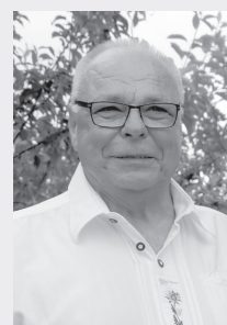
Stutzmiller Karl-Josef