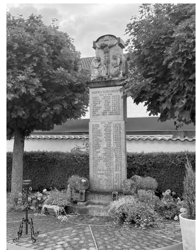
Kriegerdenkmal Landshausen

8.45 Uhr Gottesdienst-Beginn in Landshausen