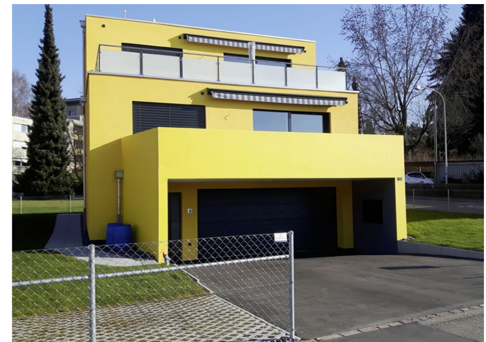
Hier wäre eine mutigere Gestaltung der Umgebung wünschenswert. Die Urban Psychology sieht hier eine monotone Umgebung. Auch wenn immerhin versucht wird, Gegensteuer zu geben mit fröhlich wirkender gelber Farbe und einem am linken Hauseck platzierten Gartenzweig.

Regelwerke mit Freiheiten haben sich gut bewährt. Zum Beispiel eine wenige Meter breite Übergangszone zwischen Häusern und Strasse. Diese für Passanten einsehbareren Vorgärten können dann individuell gestaltet werden. Auch Ortsbezug ist wichtig, etwa Konzepte, die natürlich vorkom-