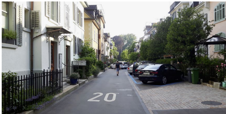
Das ästhetische Prinzip einer Vielfalt mit einer gewissen Ordnung, wie es bei einem älteren Strassenzug in Zürich umgesetzt wurde. Individuell gestaltete Freiräume ergänzen die Gebäudestrukturen.

mende Materialien und Farben der Gegend aufnehmen. So kann jeder sein Haus individuell gestalten, aber es gibt nicht ein knallgelbes modernes Haus neben einem Chalet, das das Gesamtbild stört.