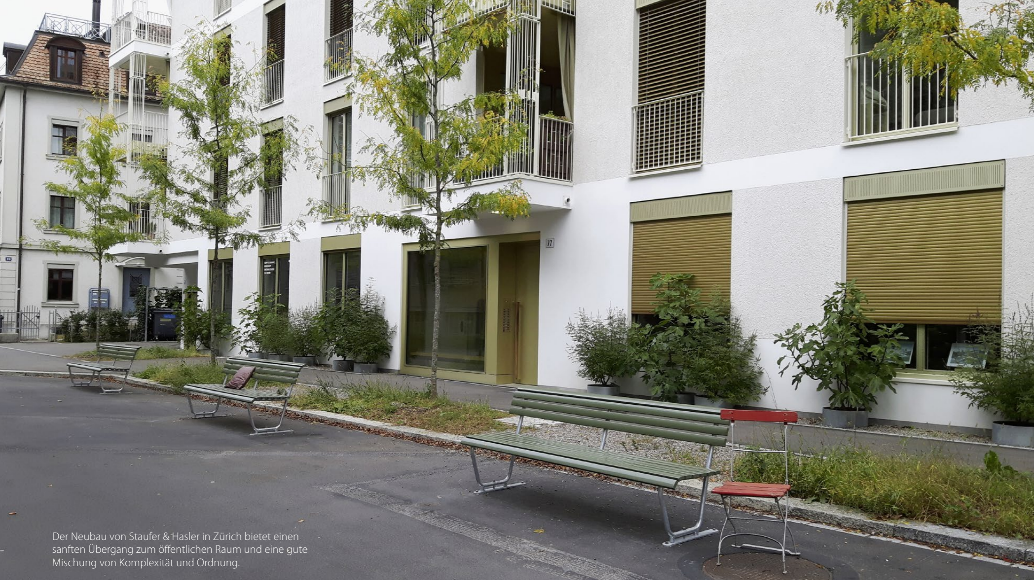
Der Neubau von Stauer & Hasler in Zürich bietet einen sanften Übergang zum öffentlichen Raum und eine gute Mischung von Komplexität und Ordnung.