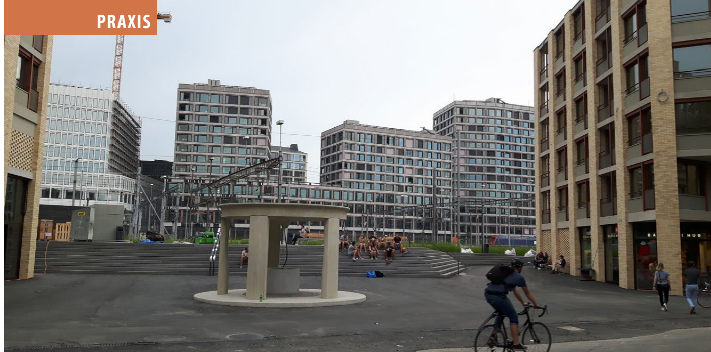
Architektonisch zeigt sich hier durchaus eine Anspruchshaltung. Aus Sicht der Urban Psychology erhitzen sich die kargen Gebäudelandschaften jedoch im Sommer so stark, dass die Aufenthaltsqualität fraglich sein dürfte.