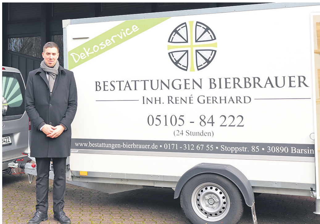
Im firmeneigenen Anhänger des Bestattungsunternehmens Bierbrauer befindet sich eine breite Auswahl an Dekorationsmaterialien, um jede Trauerfeier individuell gestalten zu können.