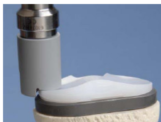
Abbildung 3 – Neues Instrument – Katalognummer 00-5413-020-03

Um die Rillenlücke zu beseitigen, wurde das chirurgische Verfahren abgeändert und umfasst die Verwendung des neuen peripheren Rippenimpaktors (Abbildung 3 - links).