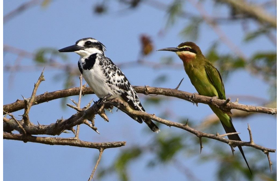
Graufischer und Madagaskar Spint