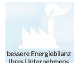
Effekte von gereinigter Luft