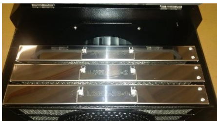
Vorfiltereinheit mit 3 nummerierten auswaschbaren Filterkassetten.