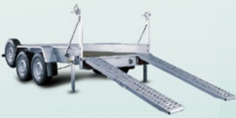
B2032HTP / B2532HTP / B3032HTP