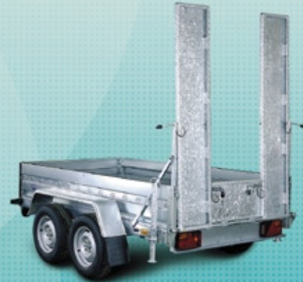
B2030HTP / B2530HTP