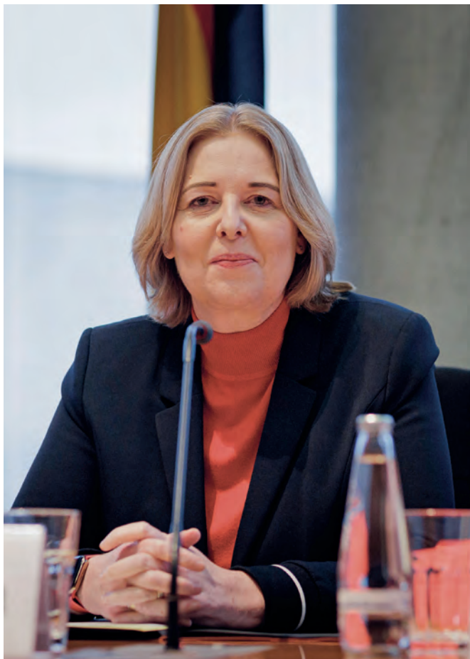
Bärbel Bas, Präsidentin des Deutschen Bundestages