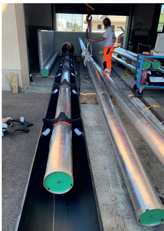
Bild 2 Verlegung einer Anlage mit Rollensystem.

nur sechs Einzelteilen statt der rund 65 des traditionellen geschraubten Flanschdesigns aus. Das erleichtert die Installation im Feld erheblich. Zudem ermöglicht der schraubenlose Flansch viel höhere Betriebsdrücke im System als das traditionelle Flanschdesign.