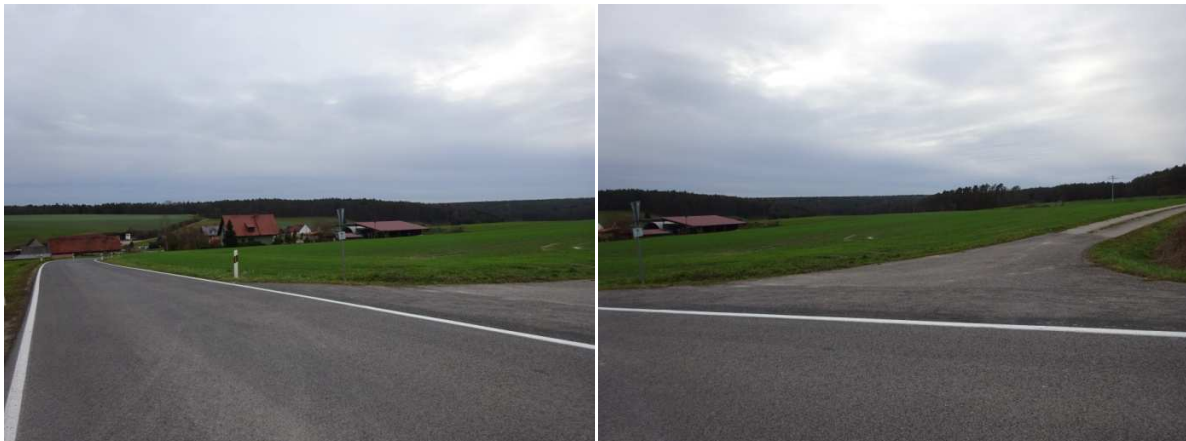
Blick nach Süden auf Oberweiler, ein Wohnhaus mit einem Betriebsgebäude ist von hier aus sichtbar, dieser Betrieb liegt außerhalb des Dorfgebietes. Die Solaranlagen sind nördlich dieses Feldweges geplant.

Der nördliche Steigerwald ist eine vielfältige Landschaft mit großen Waldgebieten zur westlichen Schichtstufe hin. Die Hochlagen des nördlichen Steigerwalds sind durch großflächige Wälder und kleine Weiler in Waldinseln geprägt. Diese Waldinseln sind landwirtschaftlich genutzt. Oberweiler liegt in einer Mulde, die nach Nordwesten zum Tal der Mittelebrach führt. Das Planungsgebiet zieht sich nach Norden hoch. Die Ackerflächen sind offen und unstrukturiert. Am Südrand der westlichen Fläche stehen zwei Obsthochstämme, ein weiterer Obsthochstamm steht nach den Feldscheunen am südlichen Rand der geplanten Solarfläche.