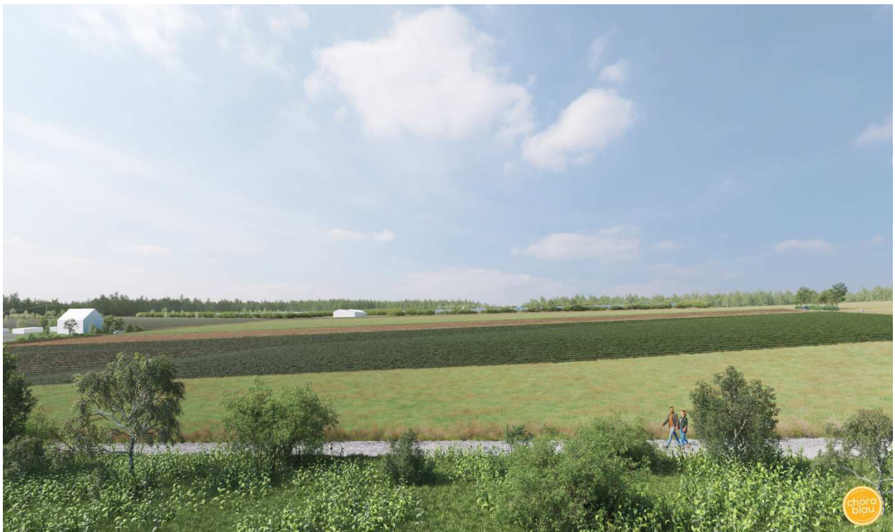
Blick von Südosten nach Nordwesten, Visualisierung der Anlage mit Darstellung der Hecken an den südlichen Rändern

Die folgende Abbildung zeigt die gleiche Blickrichtung jedoch mit den geplanten Hecken an der Südseite der Anlagen, die wenn sie voll entwickelt sind, die Anlagen in weiten Bereichen verdecken.