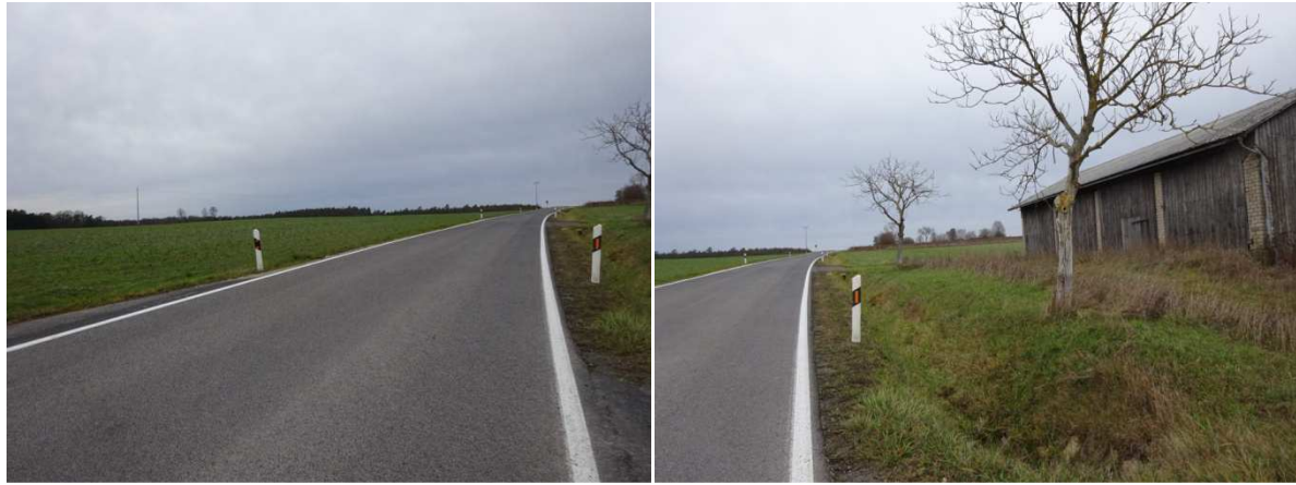
Blick nach Norden entlang der BA23, östlich angrenzend Feldscheunen