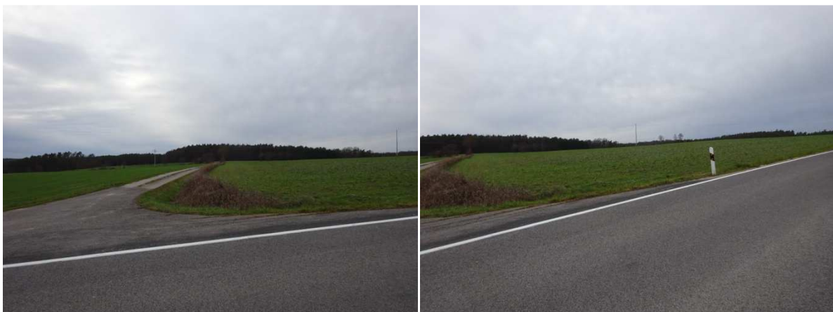
Blick nach Westen von der Kreisstraße BA23 aus mit Blick auf die querende 20KV-Leitung