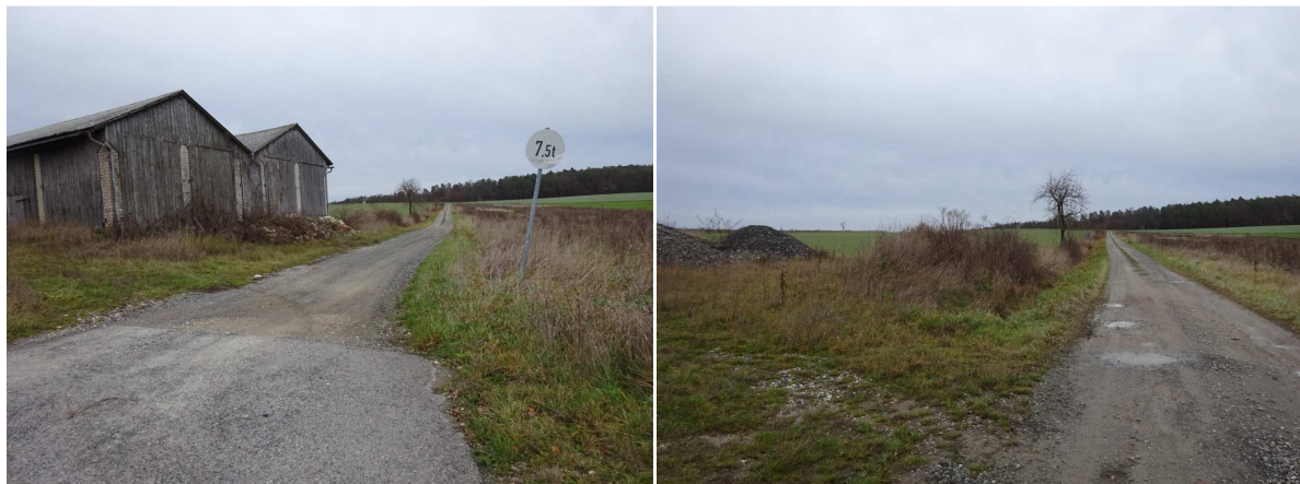
Blick nach Osten, die Feldscheunen liegen außerhalb des Geltungsbereichs, die Photovoltaikanlagen liegen nördlich des Weges.

Die Flächen sind relativ eben und liegen knapp am Hochpunkt des Geländes.