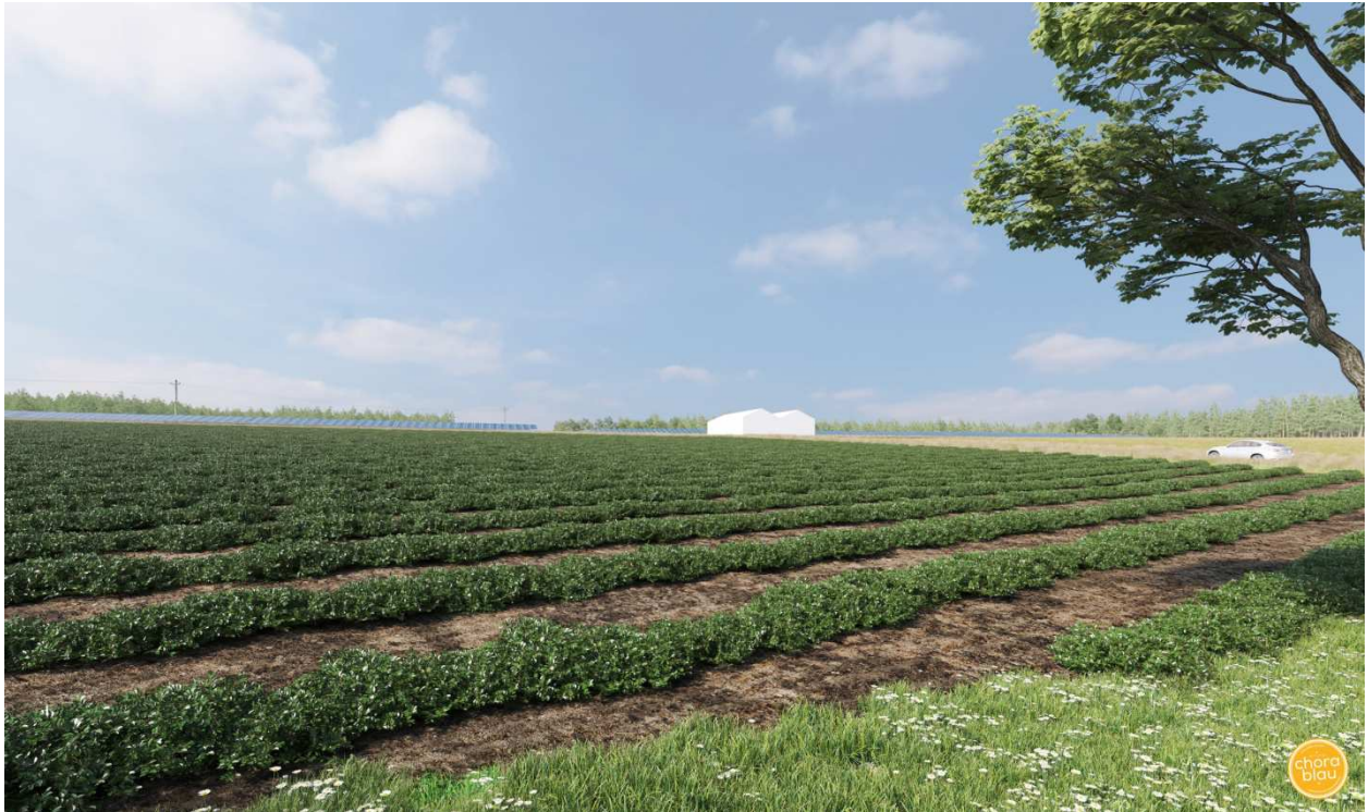
Blick von Südwesten nach Nordosten auf die Feldscheunen, Visualisierung der Anlage ohne Darstellung der Hecken an den südlichen Rändern