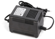
24 V AC/3 A Stromversorgung