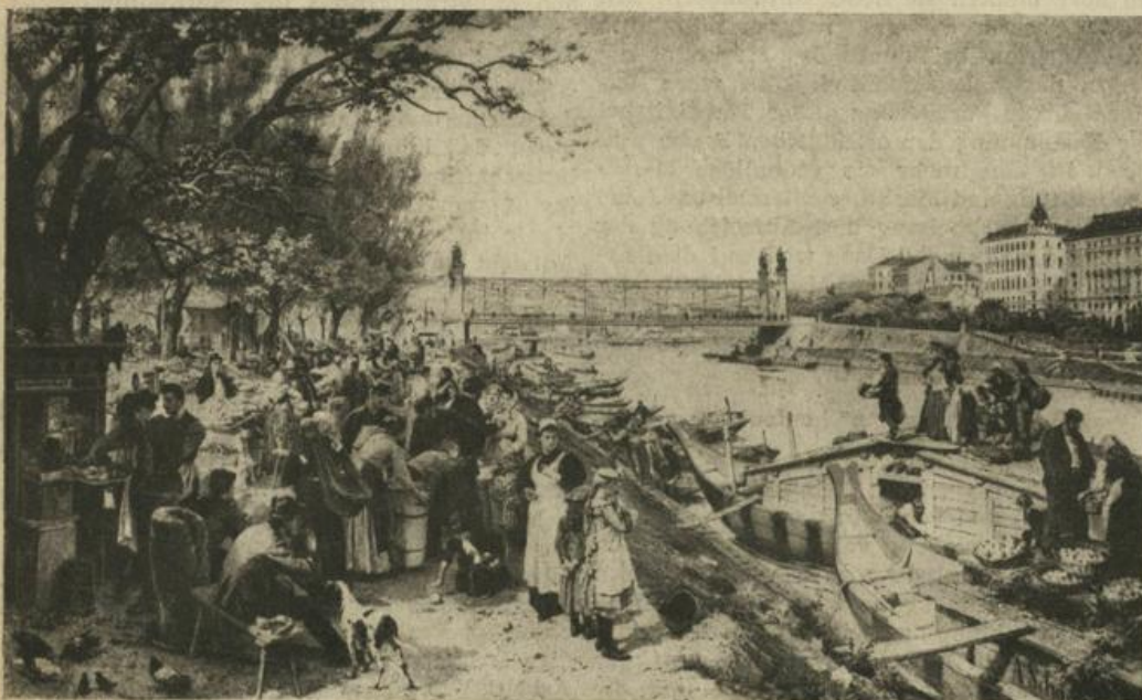
Obstmarkt am Schanzl 1895 (von Alois Schönn)

Der Asphalt der Straßen ist wieder blitzblank und sauber. Die breiten Bürsten eines