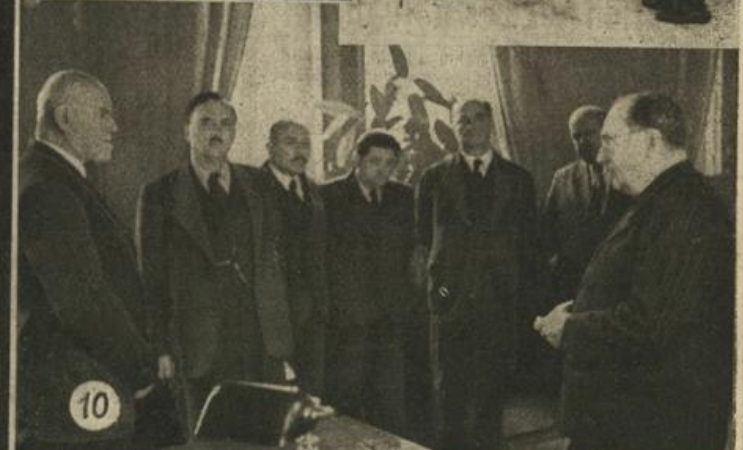
1.—6. (Zu unserem Artikel auf Seite 1): Der neu aufgebaute Schlinger-Markt. — Die ständige Ausstellung des Marktamt der Stadt Wien. — Auch Waagen werden kontrolliert. — Gemüse beim Großverteiler auf dem Naschmarkt. — Wöchentlich wird das Brot untersucht. — Wer kennt nicht die freundlichen und reschen Ständerinnen. — 7. Care-Pakete für städtische Heime. — 8.—10. Neujahrsempfang im Rathaus: Magistratsdirektor Dr. Kritscha überbringt die Glückwünsche der Beamtenschaft. — Der Trompeterchor der Stadt Wien beim traditionellen Silvester-Turmblosen. — Vizebürgermeister Hanay spricht für die Sozialistische Partei.