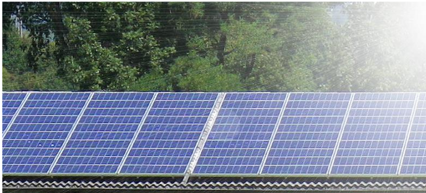
30kW Solarpanel der DKT auf Landwirtschaftsgebäude