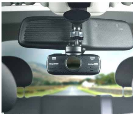
Dashcam zur Unfallaufzeichnung