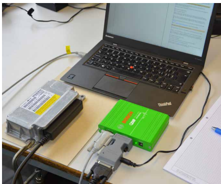
Auslesung ausgebautes Steuergerät