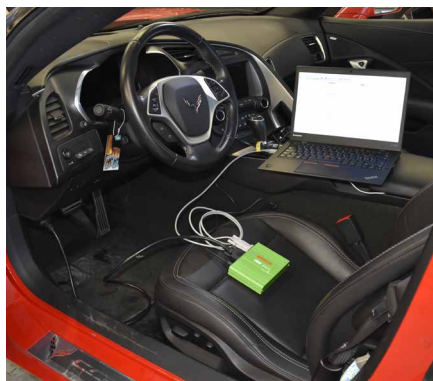
Bosch CDR im Einsatz