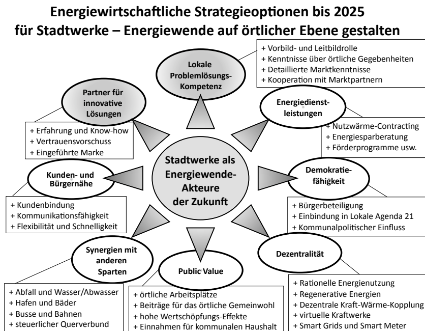
Abbildung 2: Neugegründete Stadtwerke bieten zahlreiche Vorteile und Strategieoptionen im Rahmen der örtlichen Energiewende