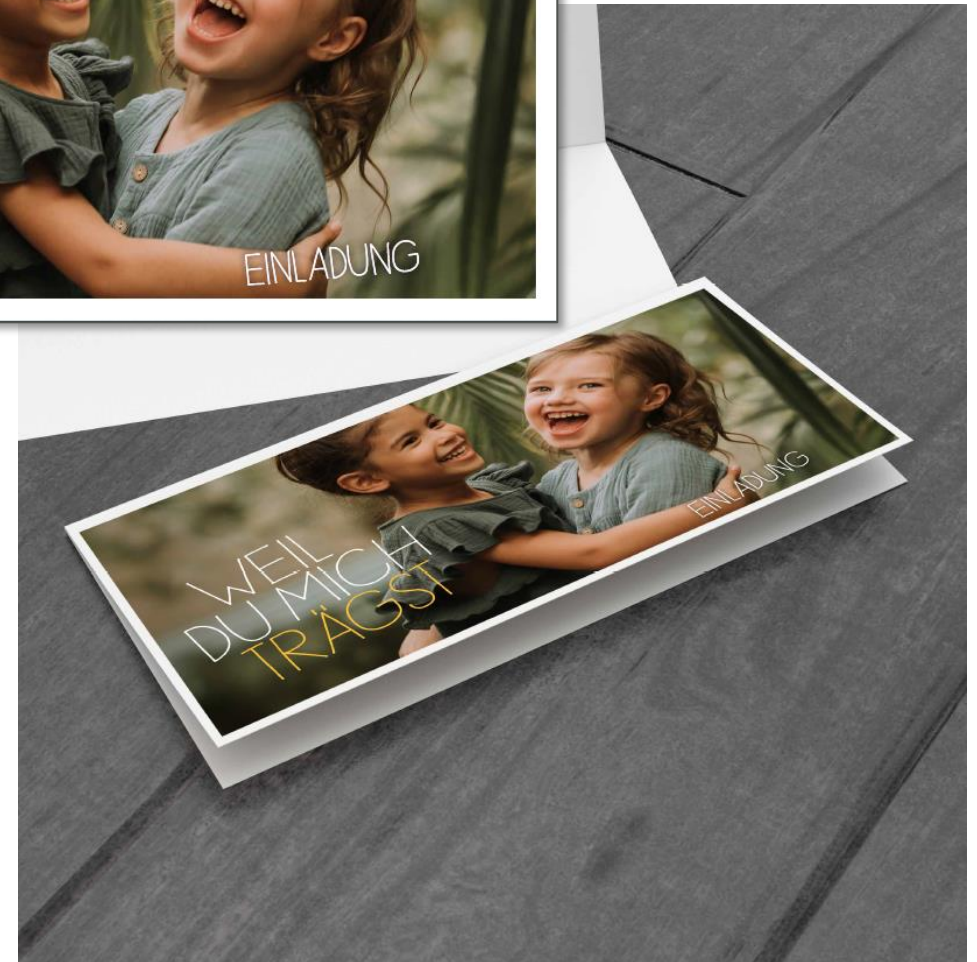
ALLE BILDMOTIVE ENTWURF STAND SEPTEMBER 2022