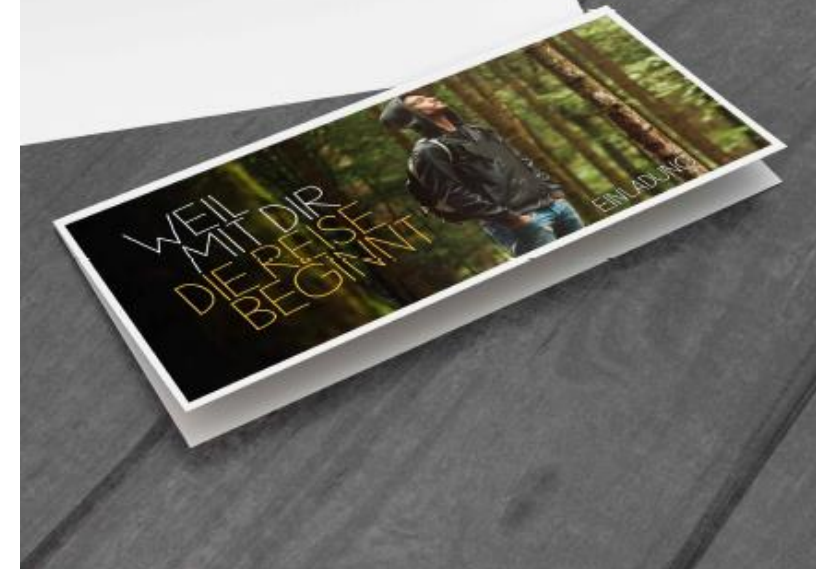
ALLE BILDMOTIVE ENTWURF STAND SEPTEMBER 2022