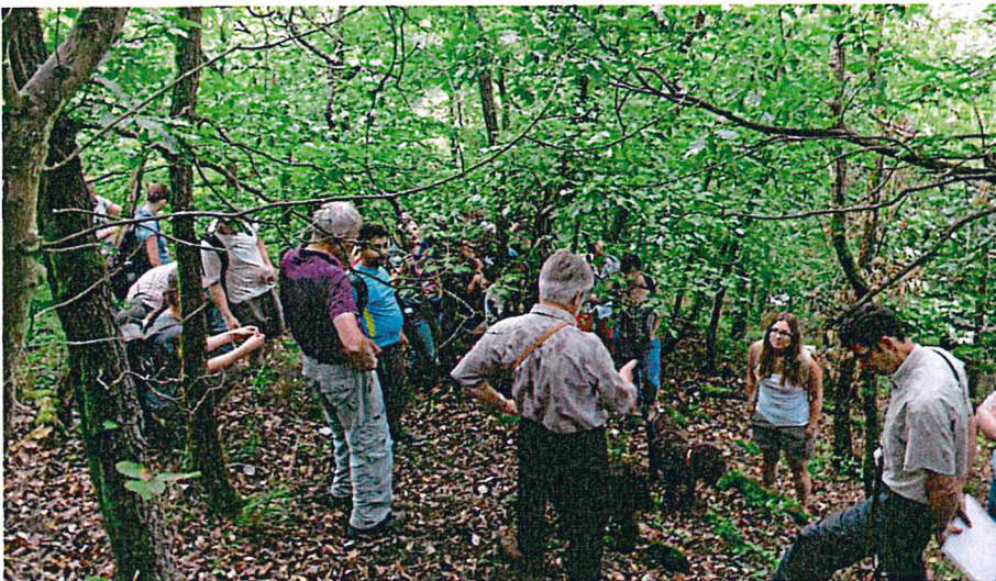
Abb. 1: Teilnehmer der Trainingsschool bei der Diskussion waldbaulicher Konzepte im Steilhang

Hier setzt die im Jahr 2013 auf eine Initiative des Instituts für Forstbenutzung der Universität Freiburg begründete COST Action FP 1301 EuroCoppice an: Ihr Ziel ist es, durch wissenschaftliche Zusammenarbeit im europäischen Rahmen vorhandene Kenntnisse und Erfahrungen auszutauschen, offene Fragen zu identifizieren und durch gemeinsame Forschungsprojekte zu ihrer Lösung beizutragen. Auf dieser Grundlage sollen zukunftsgerichtete Konzepte zum Umgang mit Niederwald im europäischen Kontext erarbeitet und daraus Empfehlungen für Politik und ‚Stakeholder‘ aus Wirtschaft und Gesellschaft abgeleitet werden. Der thematische Fokus ist dabei breit und reicht von ökologischen Fragestellungen über Waldbau, Nutzung, Verwertung und Naturschutz bis hin zu forstpolitischen und -historischen Aspekten, die in fünf thematischen Arbeitsgruppen („working groups“) thematisiert werden. Heute arbeiten ca. 140 WissenschaftlerInnen/Experten aus 35 EU- und Nachbarländern