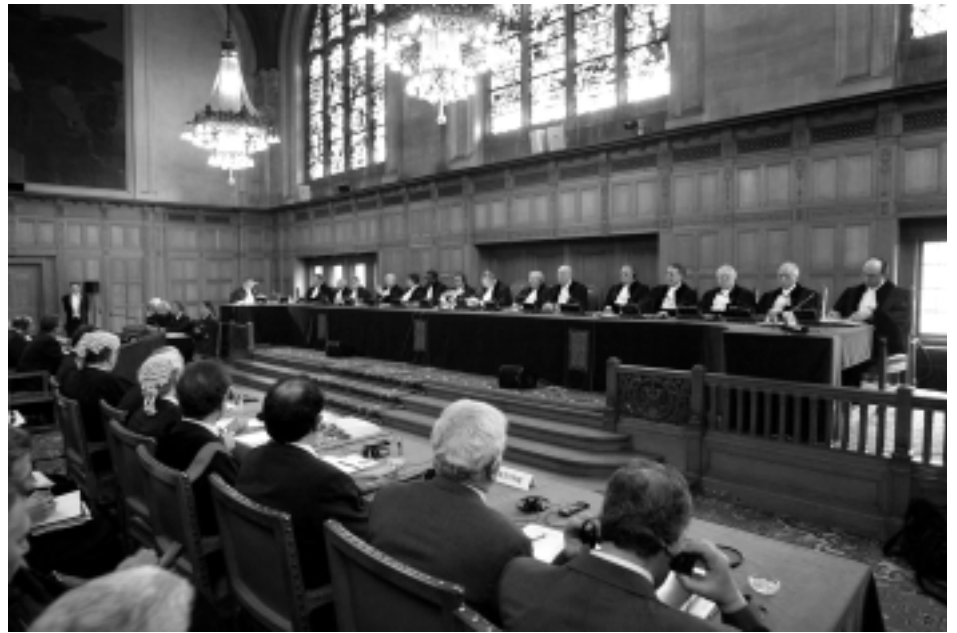
Vom 23. bis zum 25. Februar 2004 fand die Anhörung über die israelische Sperranlage vor dem Internationalen Gerichtshof in Den Haag statt. Die UNO-Vollversammlung hatte um ein Gutachten gebeten, aber nur wenige Länder trugen hier vor. Die EU-Länder, die USA und selbst Israel begnügten sich mit schriftlichen Stellungnahmen. Eine Entscheidung wird Mitte Juli 2004 erwartet.

Eine erste Gruppe von Einwänden betrifft die Fairness des Verfahrens. Das Verfahren sei nicht ausgewogen, da es nur einen Teilkomplex des Problems behandle und andere wesentliche Gesichtspunkte, insbesondere die terroristische Bedrohung gegen Israel ausklammere. Darauf kann man zunächst einmal ganz formal antworten, dass es eine Entscheidung der Generalversammlung ist, über welche Fragen sie den Rechtsrat des Gerichtshofs in Anspruch nehmen will. Diese Entscheidung ist vom Gerichtshof nicht zu hinterfragen. Jenseits dieses formalen Arguments trifft der Einwand jedoch in der Sache gar nicht zu. Die Frage der Selbstmordattentate war und ist Be-