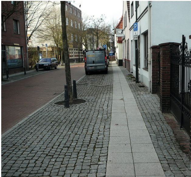
Bild 5: Beispiel für eine erschütterungsarm berollbare Oberflächengestaltung bei einem schmalen Gehweg (Quelle: Boenke)