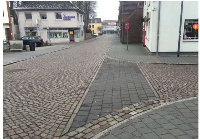
Bild 4: Erschütterungsarm berollbarer Oberflächenbelag im Zuge einer Überquerungsstelle

wegungsflächen müssen eben ausgeführt werden, um ein leichtes und erschütterungsarmes Berollen und ein sicheres Begehen zu ermöglichen. Dies gilt ebenso für die Wege im Zuge von Überquerungsstellen (Bild 4).