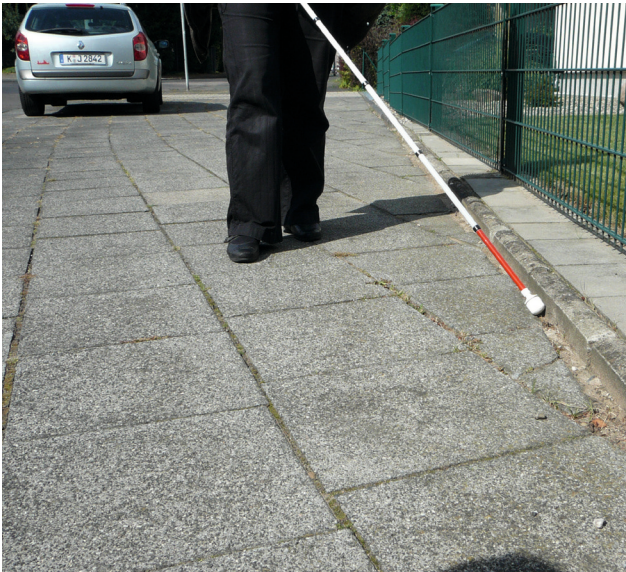
Bild 3: Linierung an der inneren Leitlinie durch Einsatz eines Tiefbords

werden, z. B. in verkehrsberuhigten Bereichen. Dies sollte aber die Ausnahme bleiben, da nur eine hohe Bordkante eine eindeutige erkennbare Abgrenzung zur Fahrbahn bildet.