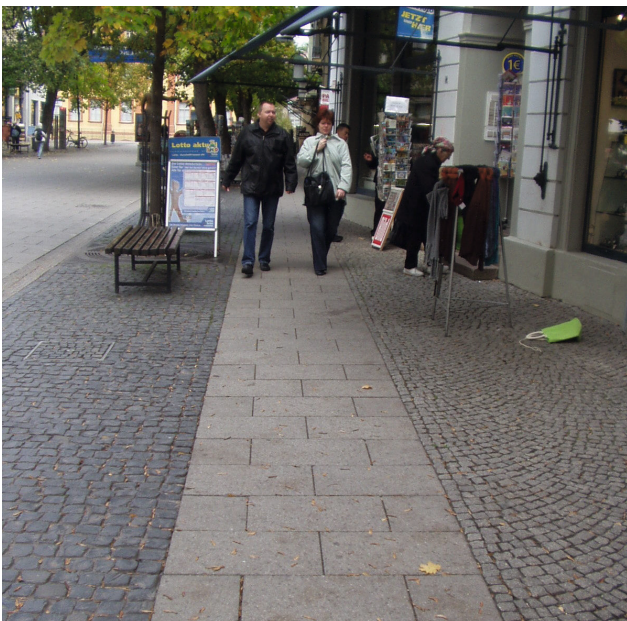
Bild 2: Materialwechsel als Mittel zur Zonierung eines Gehwegs in eine hindernisfreie Gehbahn und Funktionsbereiche für Möblierung und Geschäftsauslagen

Können Einbauten innerhalb der nutzbaren Gehwegbreite nicht vermieden werden, ist zu gewährleisten, dass sie von blinden und sehbehinderten Menschen rechtzeitig als Hindernis erkannt werden können. Dies kann durch taktil ertastbare Markierungen bzw. visuell kontrastreiche Gestaltung – vollständig oder mit Sicherheitsmarkierungen – realisiert werden. Weitere Hinweise dazu finden sich im Kap. 2.4.