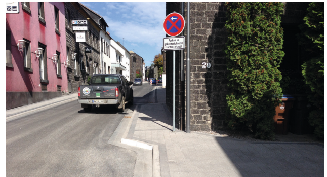
Bild 7: Durchgängige Mindestgehwegbreite an einer Engstelle im Zuge einer Ortsdurchfahrt

Verkehrsbelastung) sind unterschiedliche Lösungsansätze zu wählen, um die Engstelle sicher für alle Verkehrsteilnehmer zu gestalten [vgl. Gerlach et al. 2011]. Ziel aus Sicht der Barrierefreiheit muss es sein, auch in diesem Abschnitt eine Mindestbreite von 90 cm für die durchgängig nutzbare Gehwegbreite einzuhalten.