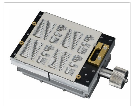
4x4" Substrataufnahme m. gummierter Oberfläche, mit mechanische Klemmung