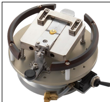
TO Aufnahme mit mechanischer Klemmung