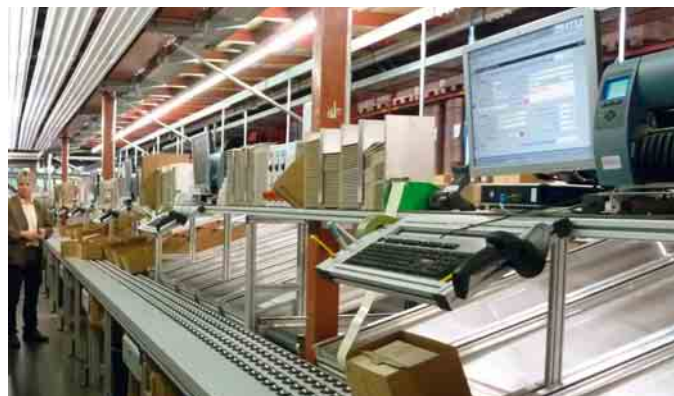
③ Am neuen Kommissionier-Sorter werden die Transport-Units (Kartons) positionsrein und in der richtigen Reihenfolge automatisch bereitgestellt