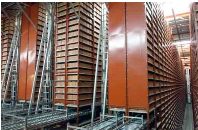
① Zur Erhöhung der Umschlagleistung im Lager und zur Reduzierung von Wartezeiten an den Kommissionierplätzen wurden zehn neue Regalbediengeräte installiert

Am Wareneingang wird das durch Lkw spedierte Material der Zulieferer überprüft. Der jeweils erste Karton einer Charge geht über die automatische Fördertechnik an das technische Prüflabor, das auf EMPA-Niveau Zugproben, Salzsprühtests, optisch taktile 3D-Messungen, Spektralanalysen usw. durchführen kann. Der Rest der Charge