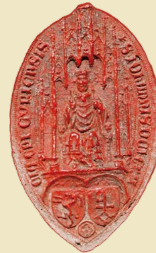
Siegel des Churer Bischofs Johannes II. Ministri aus dem Jahre 1385

Mittwoch, 25. Juni 2014, 18.00 Uhr Chur, Karlihofplatz, Mehrzweckraum im 3. Stock