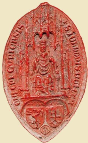
Siegel des Churer Bischofs Johannes II. Ministri aus dem Jahre 1385

Mittwoch, 25. Juni 2014, 18.00 Uhr Chur, Karlhofplatz, Mehrzweckraum im 3. Stock