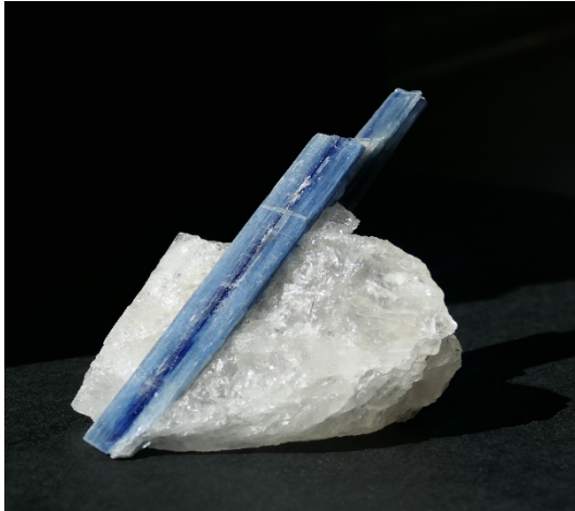
Abb. 1. Cyanit (ca. 9 cm) auf Quarz; Brasilien, Minas Gerais, Sammlung/Foto: T. Arndt.

Bioscientia Institut für Medizinische Diagnostik GmbH, Konrad-Adenauer-Straße 17, 55218 Ingelheim; torsten.arndt@bioscientia.de