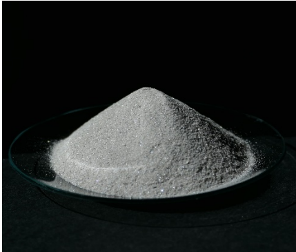
Abb. 2. Cyanitpulver als Rohstoff für die Produktion von hochfeuerfesten Steinen, Sammlung/Foto: T. Arndt.

Bei Temperaturen von 1200°C bis 1450°C wandelt sich Cyanit in Mullit um, was mit einer starken und irreversiblen Volumenausdehnung einhergeht [5]. Sie ist stärker ausgeprägt als bei den o. g. Andalusit und Sillimanit und erreicht, abhängig von Partikelgröße und Temperatur, ca. 3% für 325 mesh (45 micron) Partikel und mehr als 25% für 35 mesh (425 micron) Virginia Kyanite™ [5]. Für Rezepturen mit einem Cyanitanteil von ca. 7 Masseprozent stellt sich, partikelgrößen- und temperaturabhängig, eine Volumenzunahme von 1% bis 9% ein [5].