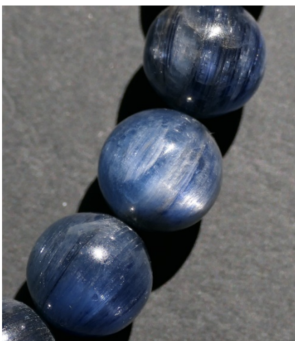
Abb. 3. Kugelkette aus blauem Cyanit.

Mullithaltige Feuerfestprodukte gelten als volumenstabil, hitze- und temperaturschock-beständig und kaum kriechend [12], d. h. sie zeigen auch unter permanenter hoher thermischer und mechanischer Belastung nur eine geringe Verformung und Bewegung. Sie sind zudem gute elektrische Isolatoren [12]. Typische Einsatzgebiete für Mullit und damit auch für Cyanit als Mullitlieferant sind feuerfeste Steine, Massen und Betone, Gießereiformsande, Schichten für Gießereien, Bremsbeläge, Keramikerzeugnisse, Brennhilfsmittel und Schleifmittel [14].