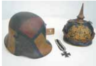
Beispiele für Ausstellungsstücke 1. Weltkrieg

Die angebotenen Erinnerungsstücke werden zunächst besichtigt und bei Eignung ab 1. Februar 2014 als Leihgaben für die Ausstellung erbeten.