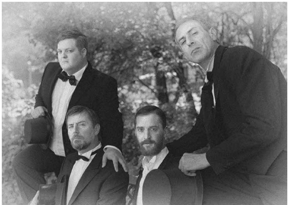
Die Haller Gassenspiele präsentieren heuer im Hof der Burg Hasegg die Komödie "Bürger Schippel" von Carl Sternheim.