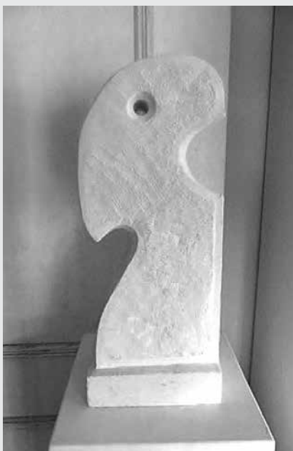
Skulptur von Eva-Maria Huter