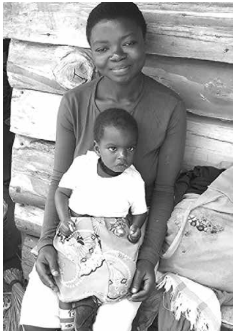
Das Leben von Kindern im Westen Ugandas zu verbessern, hat sich der Verein „Perspektive für Kinder“ zum Ziel gesetzt.