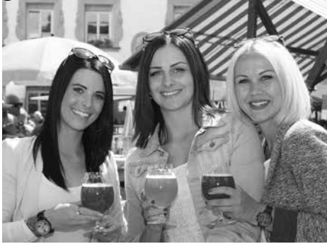
Zum Wohl!

Am Samstag, 8. Juni 2018, können sich die BesucherInnen von 10 bis 18 Uhr bei einer Verkostung am Stiftsplatz selbst von den hervorragenden heimischen Bieren überzeugen.